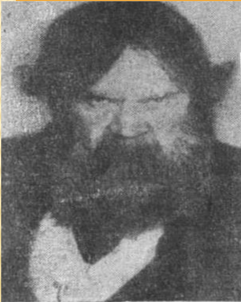
Дикой. Артист М. М. Тарханов.