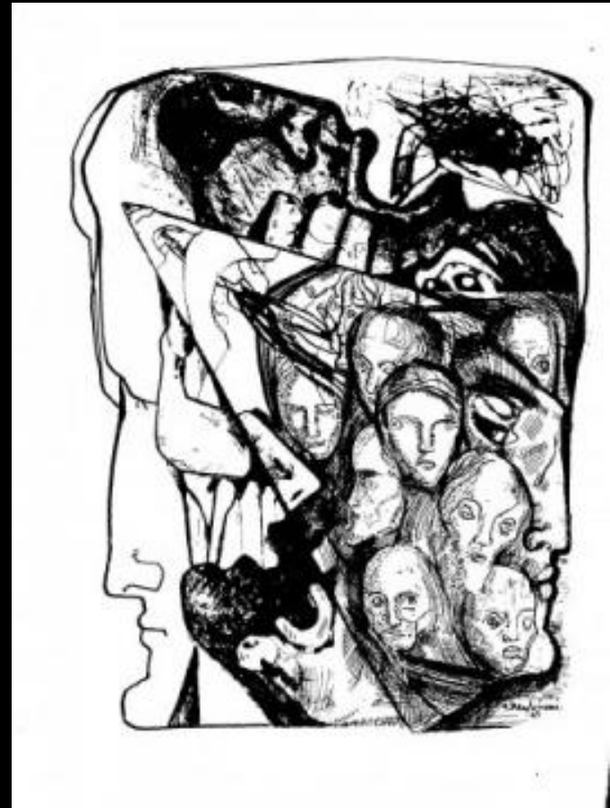
«Полифония» Э. Неизвестный

Достоевский – создатель полифонического романа, по выражению Бахтина. Полифония – многоголосица. Его герои как бы вступают в перекличку друг с другом. Автор окружает Раскольникова людьми, варьирующими те или иные мысли главного героя. При этом отрицательные элементы его теории отражают «двойники», а положительные – «антиподы».