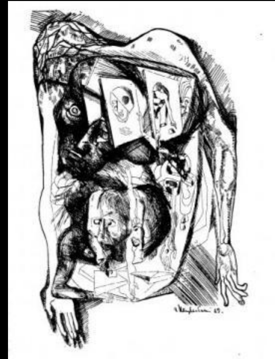
«Внутренний мир Свидригайлова» Э. Неизвестный