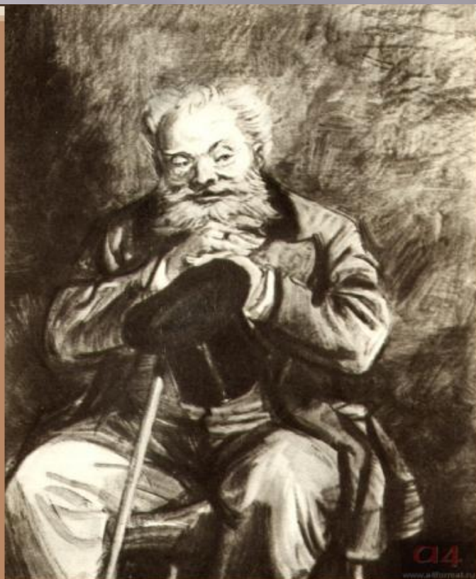
Аркадий Иванович Свидригайлов