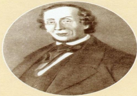
Андерсен в 1840-е г.г.

Вершиной творчества Ханса Кристиана Андерсена стали сказки. Датский физик Х.К. Эрстед, прочитав первый выпуск сборника «Сказки, рассказанные детям», заметил: «Импровизатор» прославил вас, сказки сделают ваше имя бессмертным!». Со сказками к Х.К. Андерсену пришла слава, «... начало этой славы следует отнести к 1835 году, когда Андерсен словами: «Шёл солдат по дороге: раз-два! Раз-два!» вступил в царство сказок». Первый сборник сказок назывался «Сказки, рассказанные детям» (1835 — 1837), второй — «Новые сказки» (1844 — 1848), третий — «Истории» (1852 — 1855), четвёртый — «Новые сказки и истории» (1858 — 1872). Всего Андерсен написал более ста семидесяти сказок и историй.