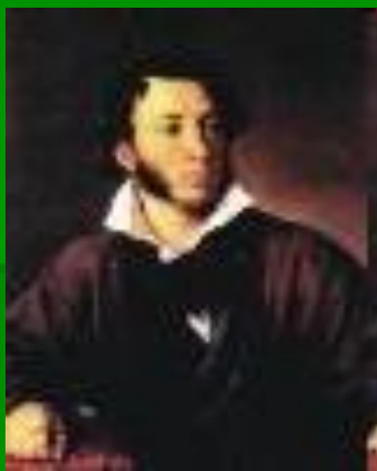
А.С. Пушкин (1799-1837)

Россия феодальная крепостническая страна