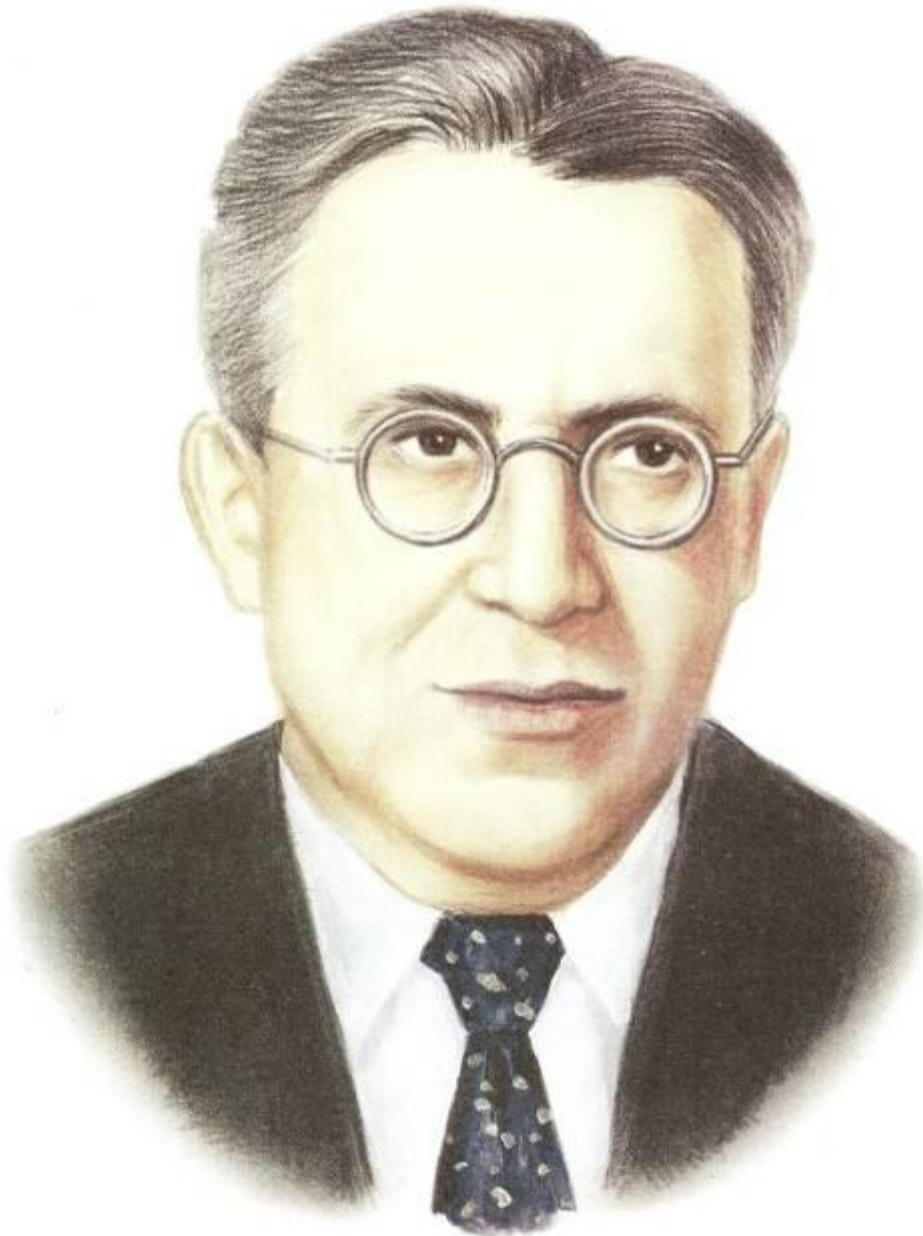
Маршак Самуил Яковлевич (1887-1964)