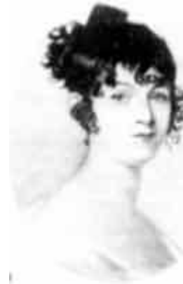
Надежда Осиповна Пушкина (1775-1836), мать поэта.