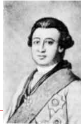
Сергей Львович Пушкин (1770-1848), отец поэта.