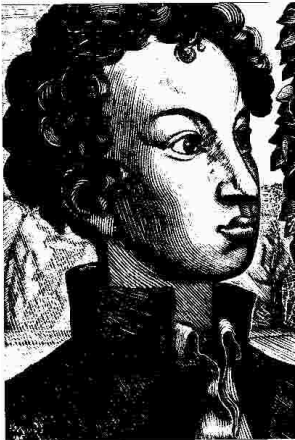
Саша Пушкин. Гравюра на дереве.