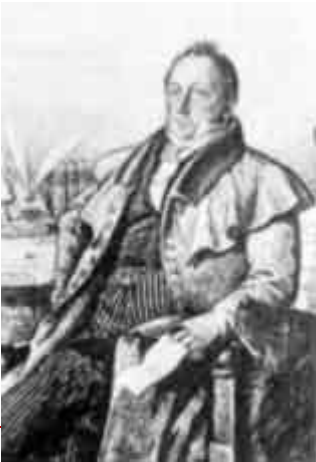
Иван Абрамович Ганнибал (1731-1801).