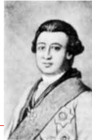
Сергей Львович Пушкин (1770-1848), отец поэта.