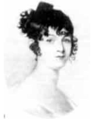
Надежда Осиповна Пушкина (1775-1836), мать поэта.