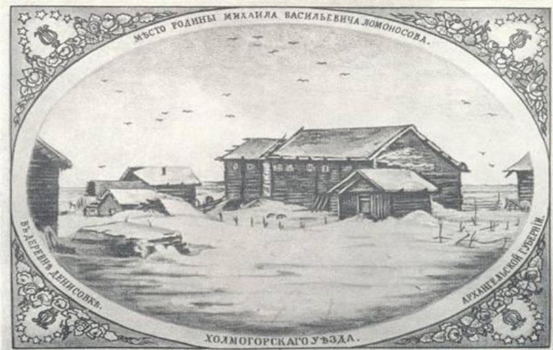
Место родины М. В. Ломоносова (с литографии XIX века).

Мать Ломоносова умерла рано. Из двух мачех вторая была «злая и завистливая». Лучшими моментами в детстве были поездки с отцом в море. Главной гордостью семьи было судно «Святой Архангел Михаил». На этом судне юный Михайло Ломоносов ходил с отцом в моря. В этих трудных походах на промысел морского зверя закалялось его сердце и мужал характер.