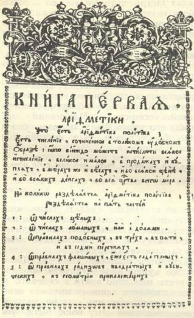
Страницы из «Арифметики» Л. Магницкого.

Ломоносов рано научился грамоте, прочел все книги, которые мог достать. В возрасте 14 лет он изучил «Арифметику» Л.Ф. Магницкого и «Славянскую грамоту» М. Смотрицкого.