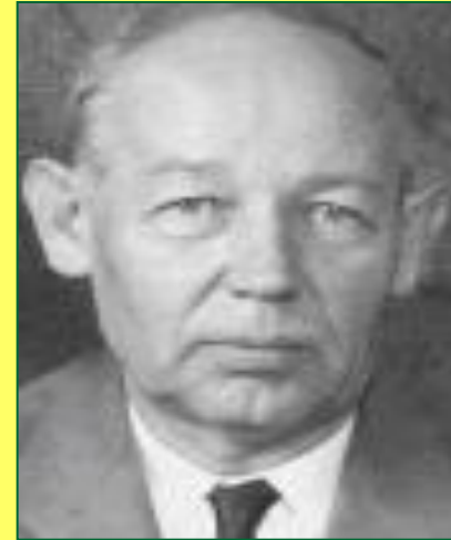
Русский геолог, исследователь Камчатки.