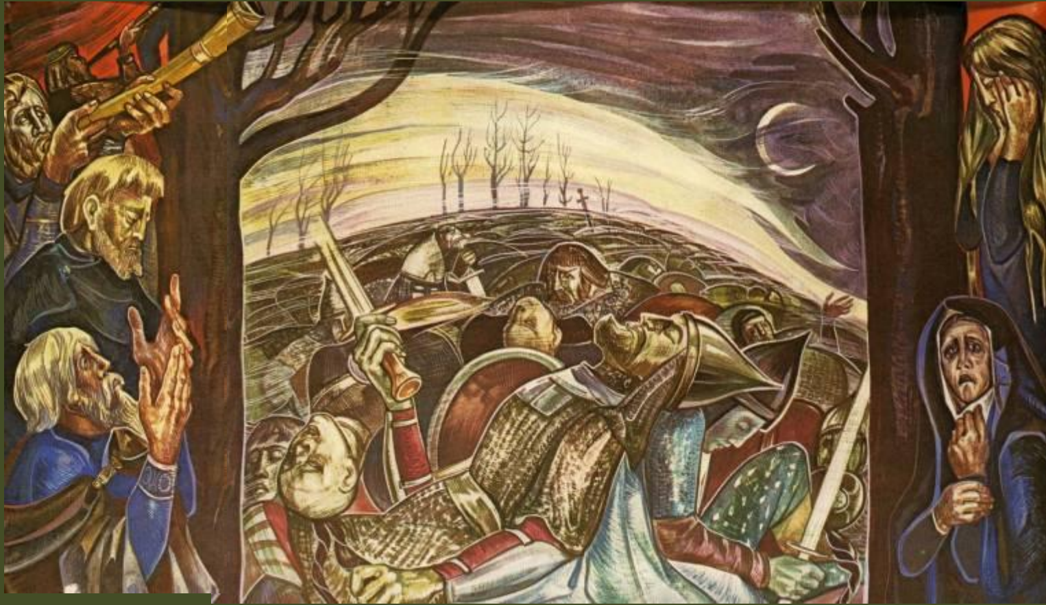
«После боя. Реквием»