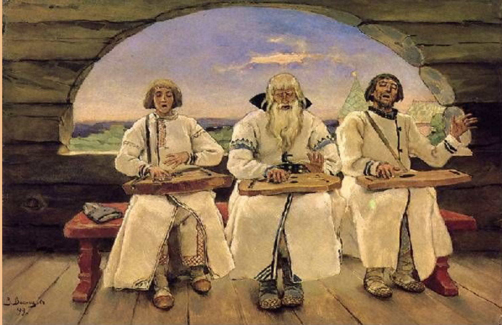
Виктор Михайлович Васнецов «Гусляры», 1899