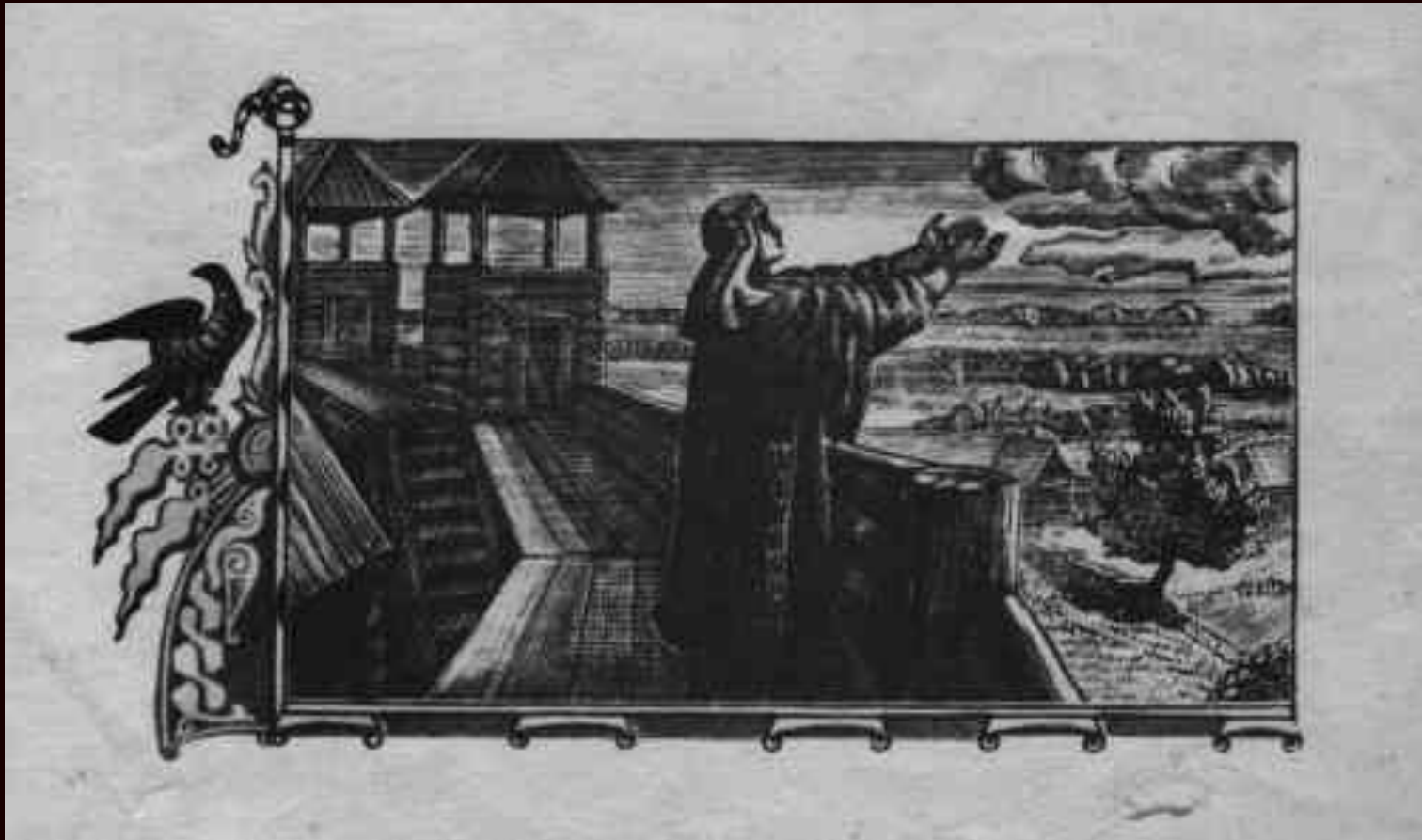
Плачь Ярославны Гравюра В.А.Фаворского

Зачем, господин, мое веселие по степи ковыльной развеял?