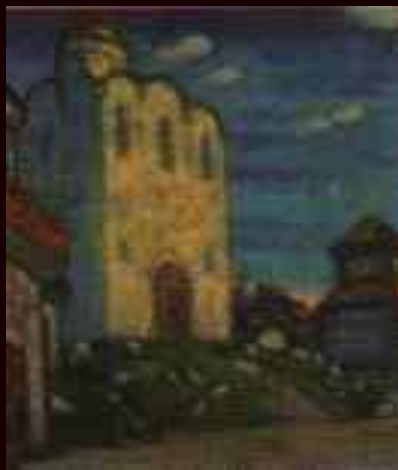
Путьгль Иллпострация Рериха

О Днепр Словутич! Ты пробил каменные горы, проходя сквозь землю Половецкую, ты лелеял на себе Святославовы ладьи до полка Кобякова – прилелей, господин, моего милого ко мне, чтоб не слала к нему слез на море рано!