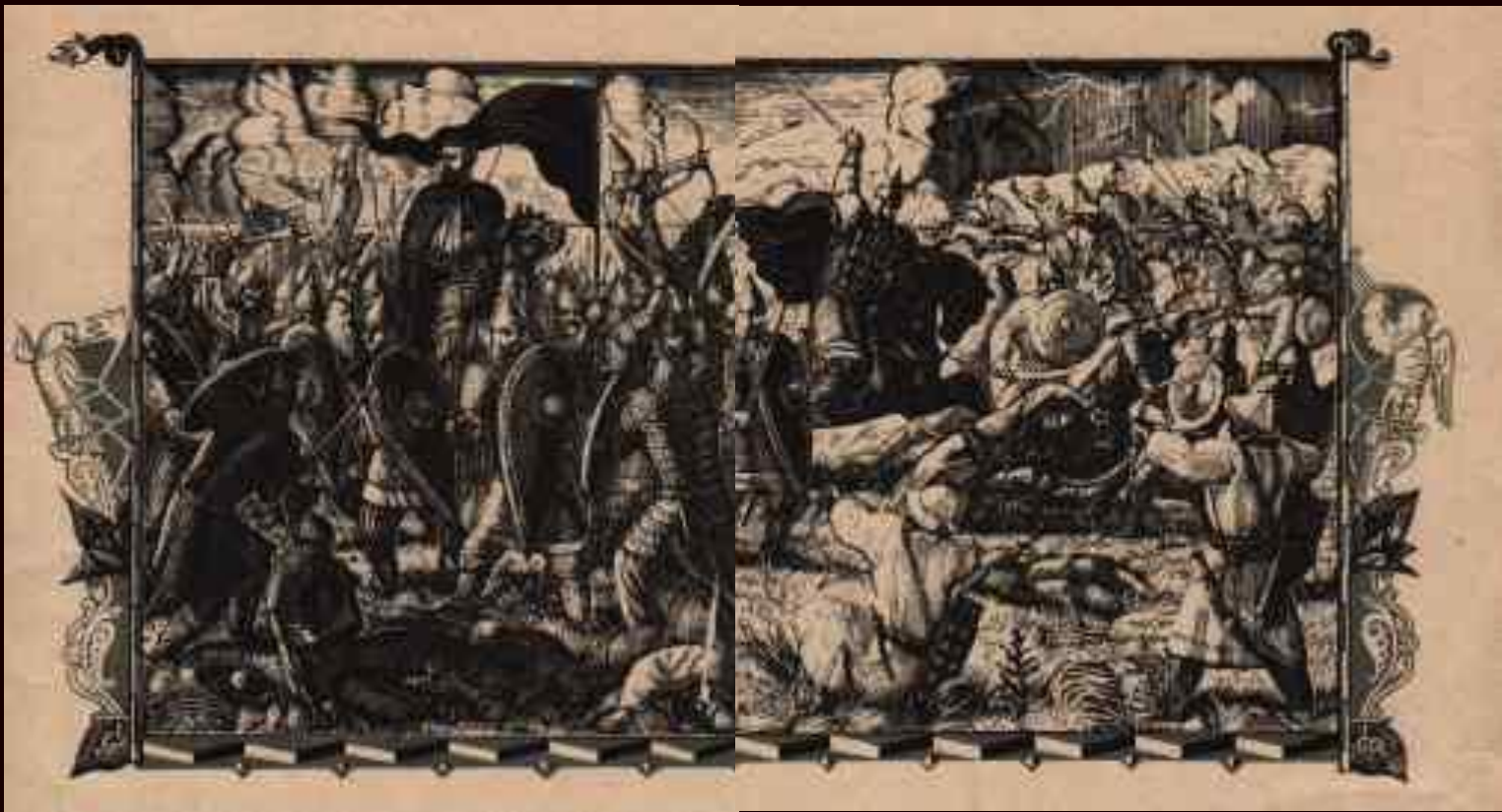
Бой с половцами. Иллюстрация Фаворского.

Бились день, бились другой, на третий день к полудня пали стяги Игоревы.