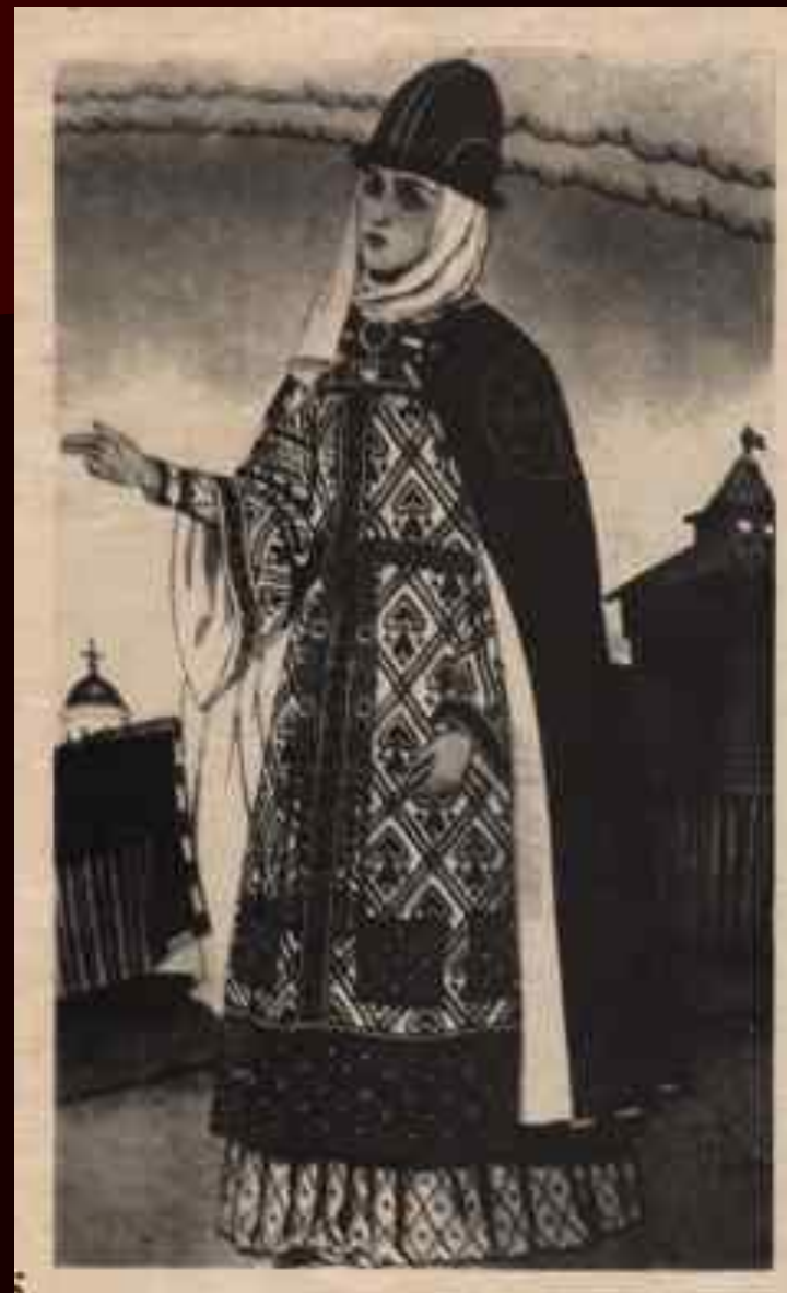
Ярословна Худ. И.Я.Билибин