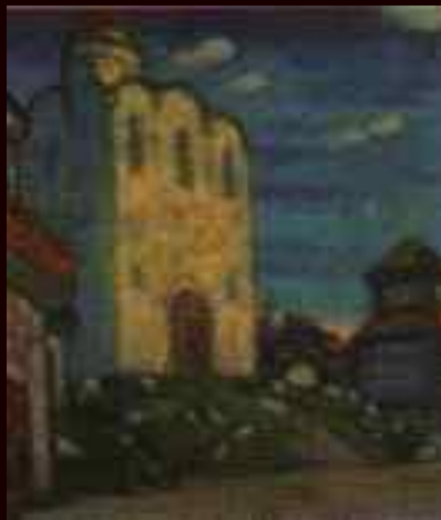
Путьчль Иллпострация Рериха

О Днепр Словутич! Ты пробил каменные горы, проходя сквозь землю Половецкую, ты лелеял на себе Святославовы ладьи до полка Кобякова – прилелей, господин, моего милого ко мне, чтоб не слала к нему слез на море рано!