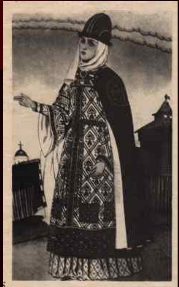
Ярословна Худ. И.Я.Билибин