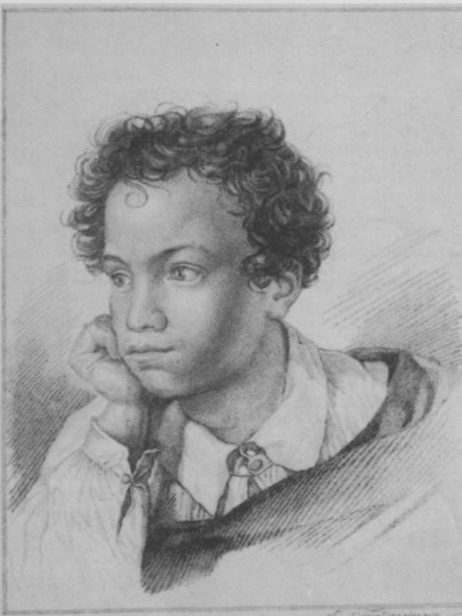
“Пушкин”. Е. И. Гейтман. 1822 г.