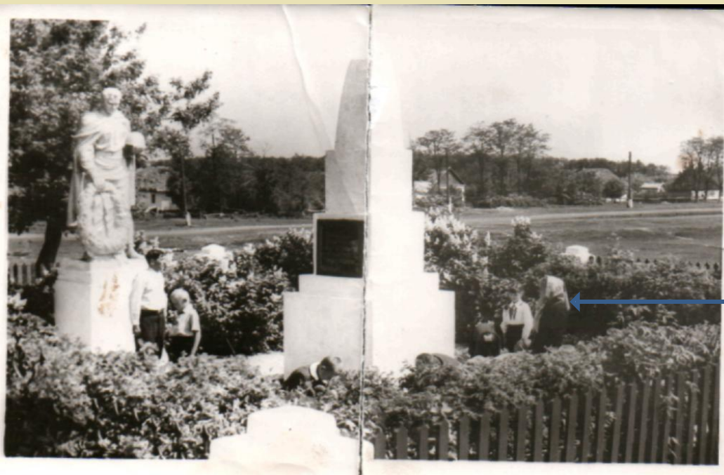
ДНЕПРОПЕТРОВСКАЯ ОБЛ., МЕЖЕВСКОЙ РАЙОН, СЕЛО УКРАИНКА

ПРАБАБУШКА ГРАЧЕВА ГАЛИНА ПАВЛОВНА НА ОТКРЫТИИ ПАМЯТНИКА РАЗВЕДЧИКАМ , ОСВОБОДИВШИМ СЕЛО, В ТОМ ЧИСЛЕ ЕЁ РОДНОМУ БРАТУ ГАЛКИНУ ЕМЕЛЬЯНУ