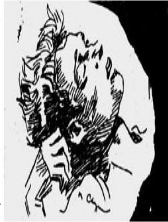
Рисунок В. Сварога, сделанный в «Англетере» 28 декабря 1925 года