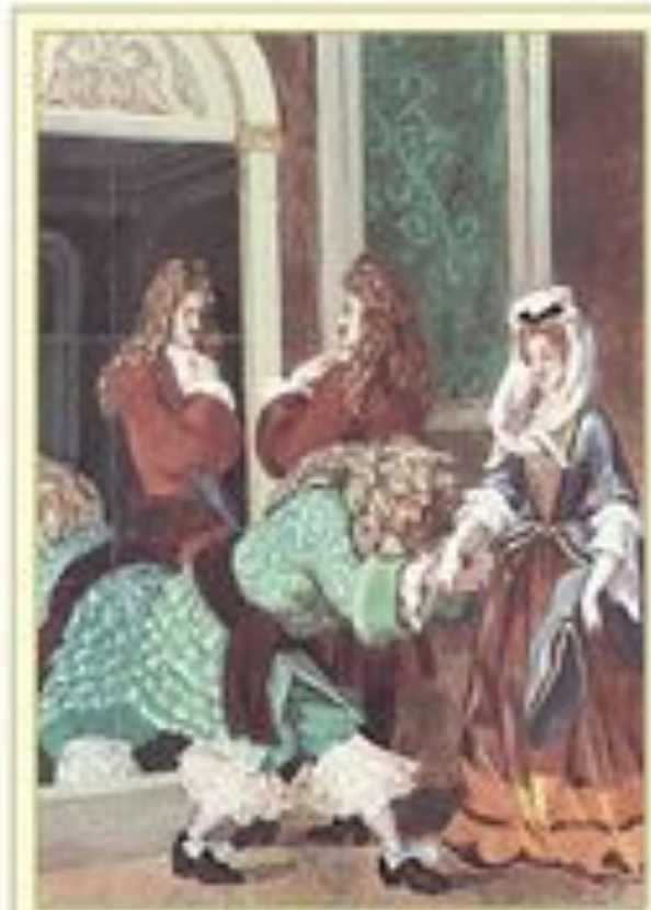
Иллюстрация к комедии Ж. Б. Мольера "Мизантроп" из дворцовой Художник А. Архипов