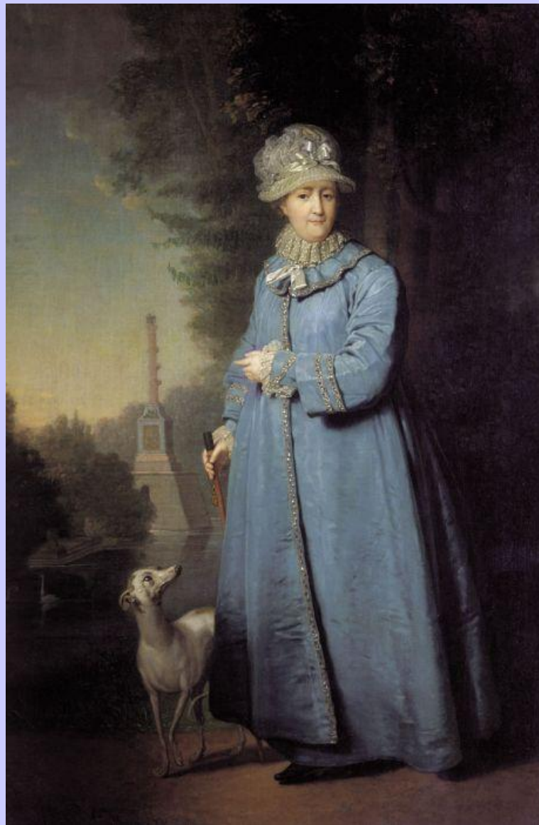
Боровиковский В. Л. Портрет Екатерины II