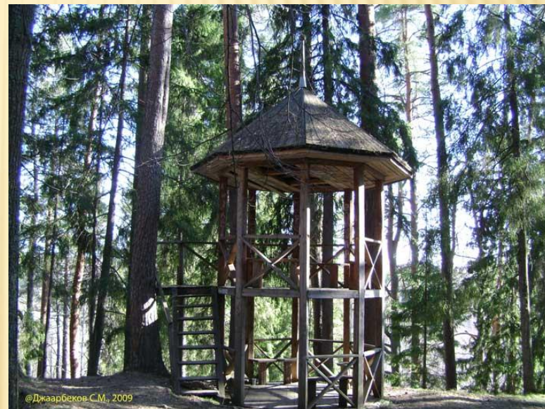
Двухъярусная беседка Считается, что здесь Островскому А.Н. пришла в голову идея создания пьесы "Снегурочка".