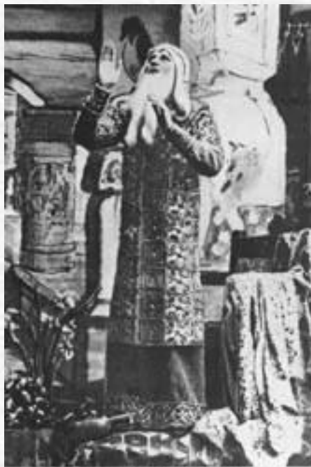
Царь Берендей — В. И. Качалов Москва. Новая Художественная опера