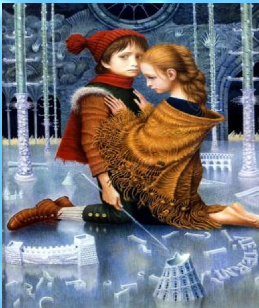
Герда во дворце снежной королевы