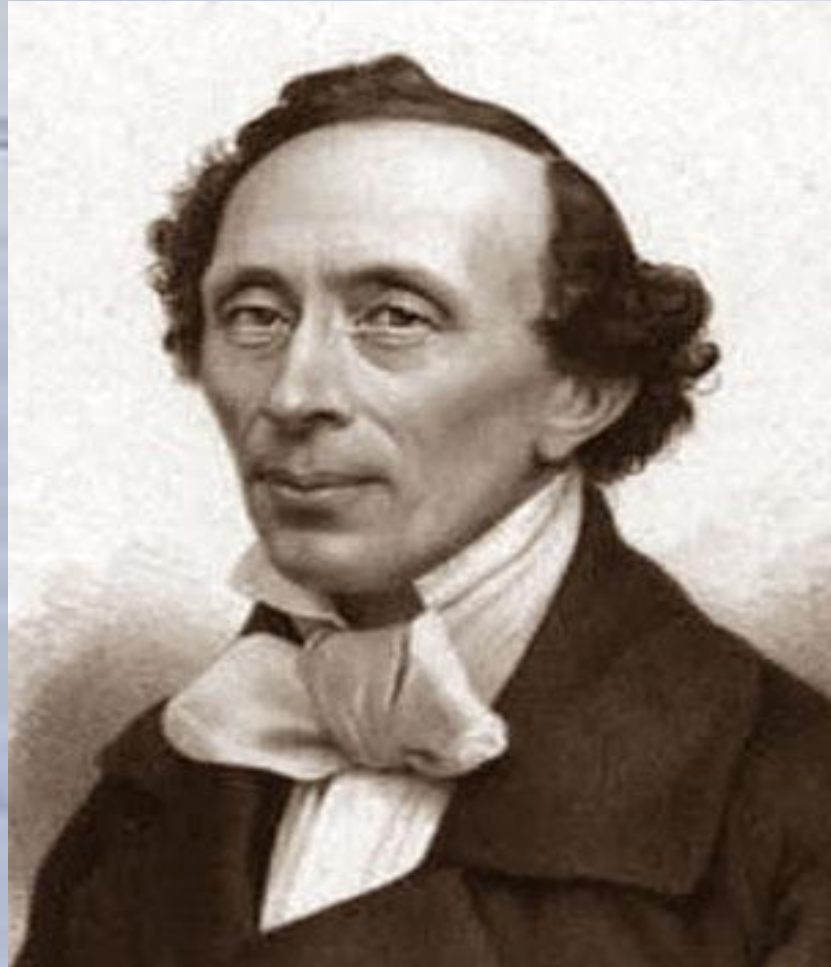
Ханс Кристиан Андерсен