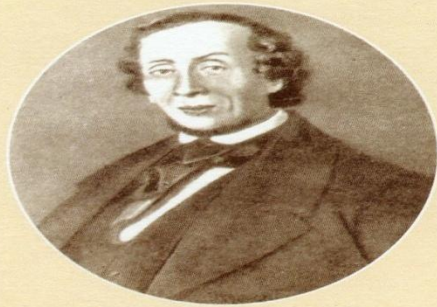
Андерсен в 1840-е г.г.

Вершиной творчества Ханса Кристиана Андерсена стали сказки. Датский физик Х.К. Эрстед, прочитав первый выпуск сборника «Сказки, рассказанные детям», заметил: «Импровизатор прославил вас, сказки сделают ваше имя бессмертным!». Со сказками к Х.К. Андерсену пришла слава, «... начало этой славы следует отнести к 1835 году, когда Андерсен словами: «Шёл солдат по дороге: раз-два! Раз-два!» вступил в царство сказок». Первый сборник сказок назывался «Сказки, рассказанные детям» (1835 — 1837), второй — «Новые сказки» (1844 — 1848), третий — «Истории» (1852 — 1855), четвёртый — «Новые сказки и истории» (1858 — 1872). Всего Андерсен написал более ста семидесяти сказок и историй.