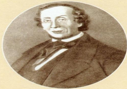
Андерсен в 1840-е г.г.

Вершиной творчества Ханса Кристиана Андерсена стали сказки. Датский физик Х.К. Эрстед, прочитав первый выпуск сборника «Сказки, рассказанные детям», заметил: «Импровизатор прославил вас, сказки сделают ваше имя бессмертным!». Со сказками к Х.К. Андерсену пришла слава, «... начало этой славы следует отнести к 1835 году, когда Андерсен словами: «Шёл солдат по дороге: раз-два! Раз-два!» вступил в царство сказок». Первый сборник сказок назывался «Сказки, рассказанные детям» (1835 — 1837), второй — «Новые сказки» (1844 — 1848), третий — «Истории» (1852 — 1855), четвёртый — «Новые сказки и истории» (1858 — 1872). Всего Андерсен написал более ста семидесяти сказок и историй.