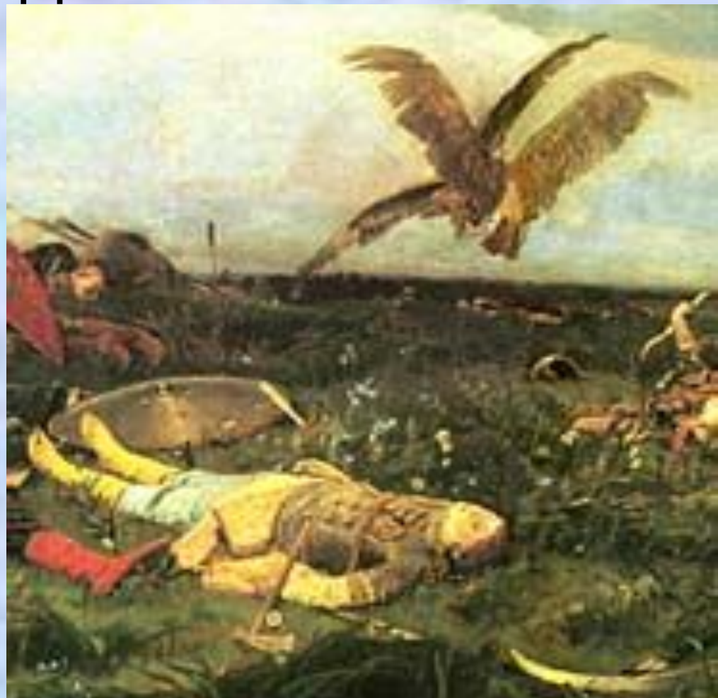
«После побоища Игоря Святославича с половцами»