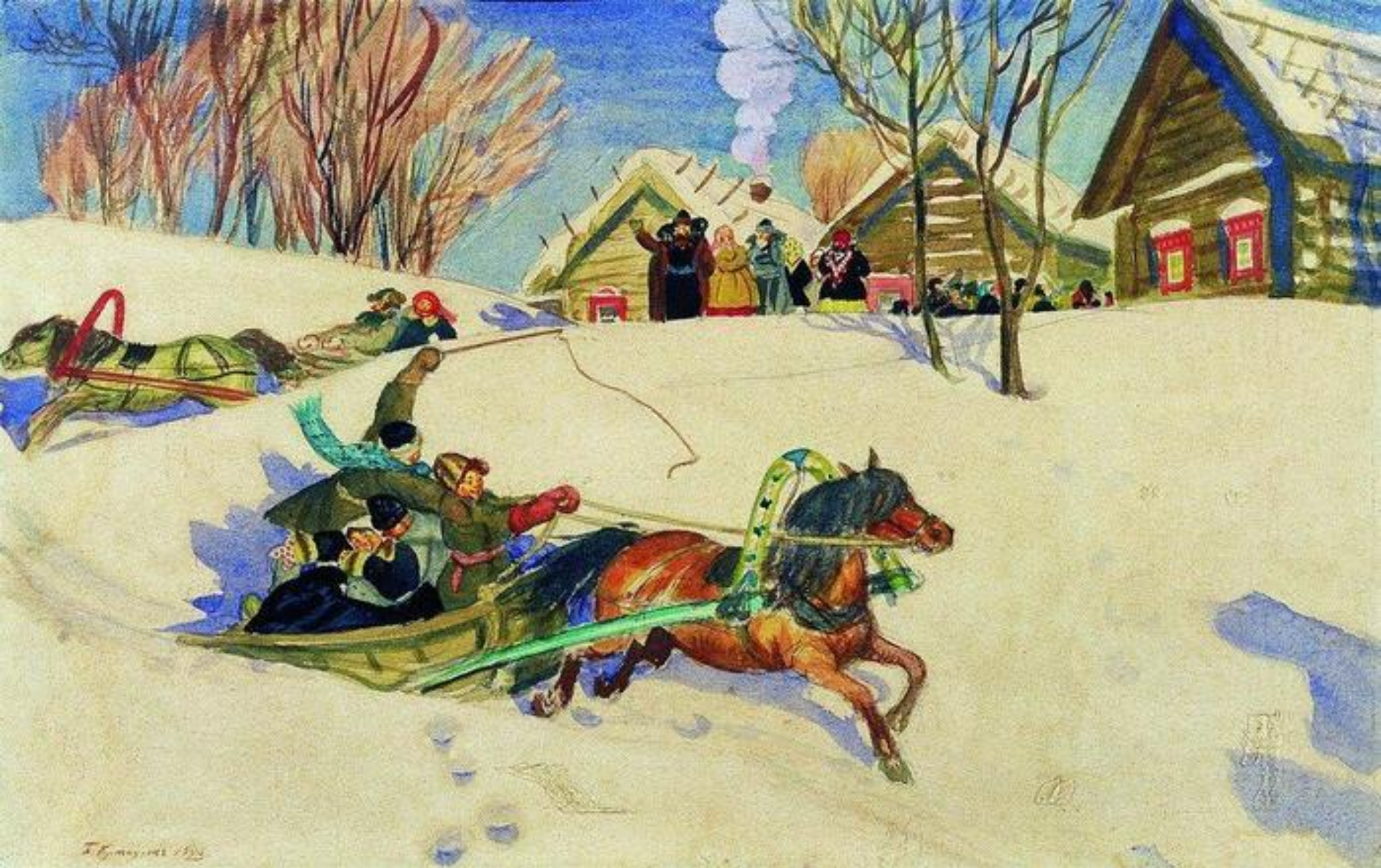
Масленица (1920) -