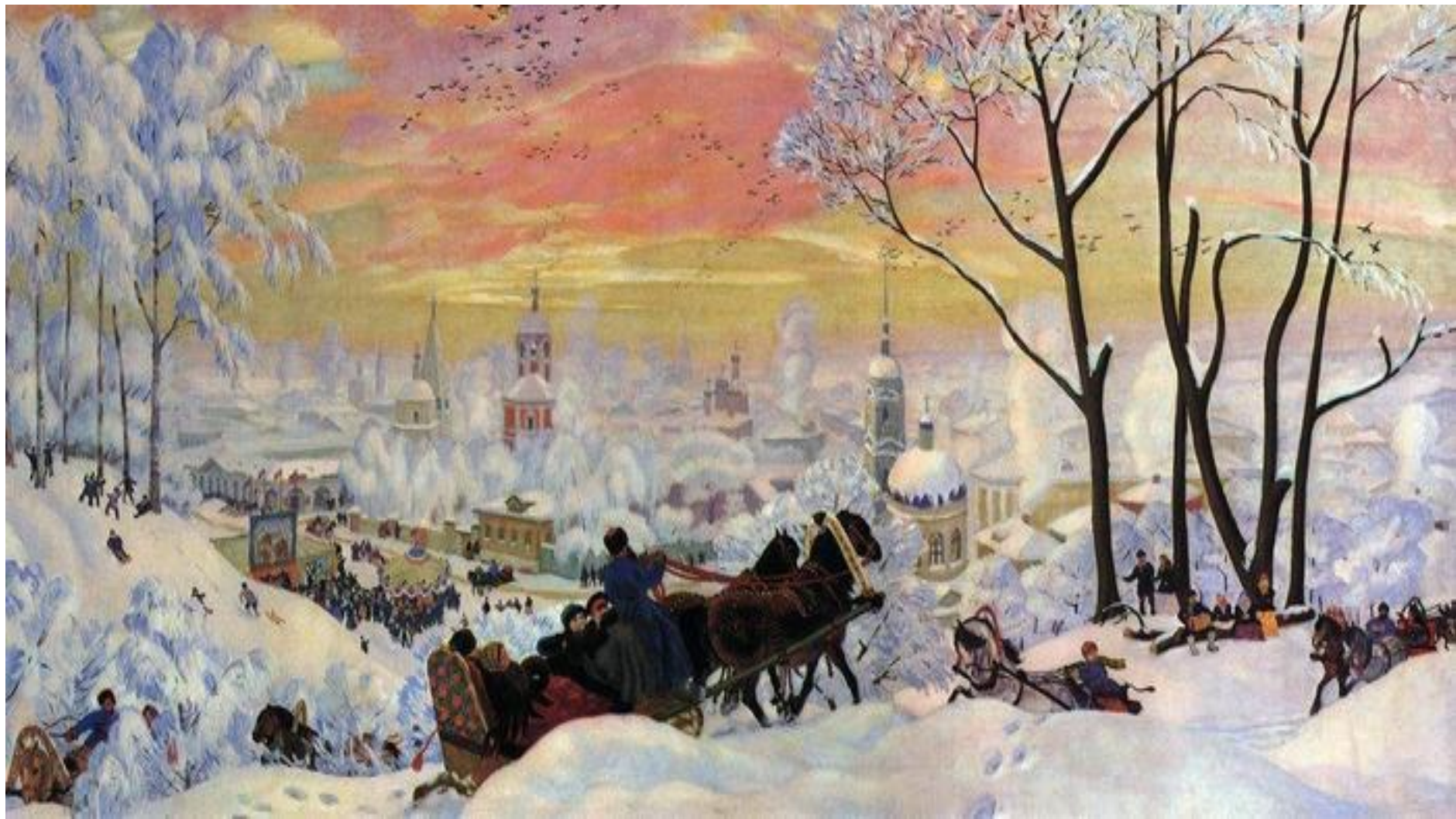
Масленица (1916)- вариант предыдущей картины