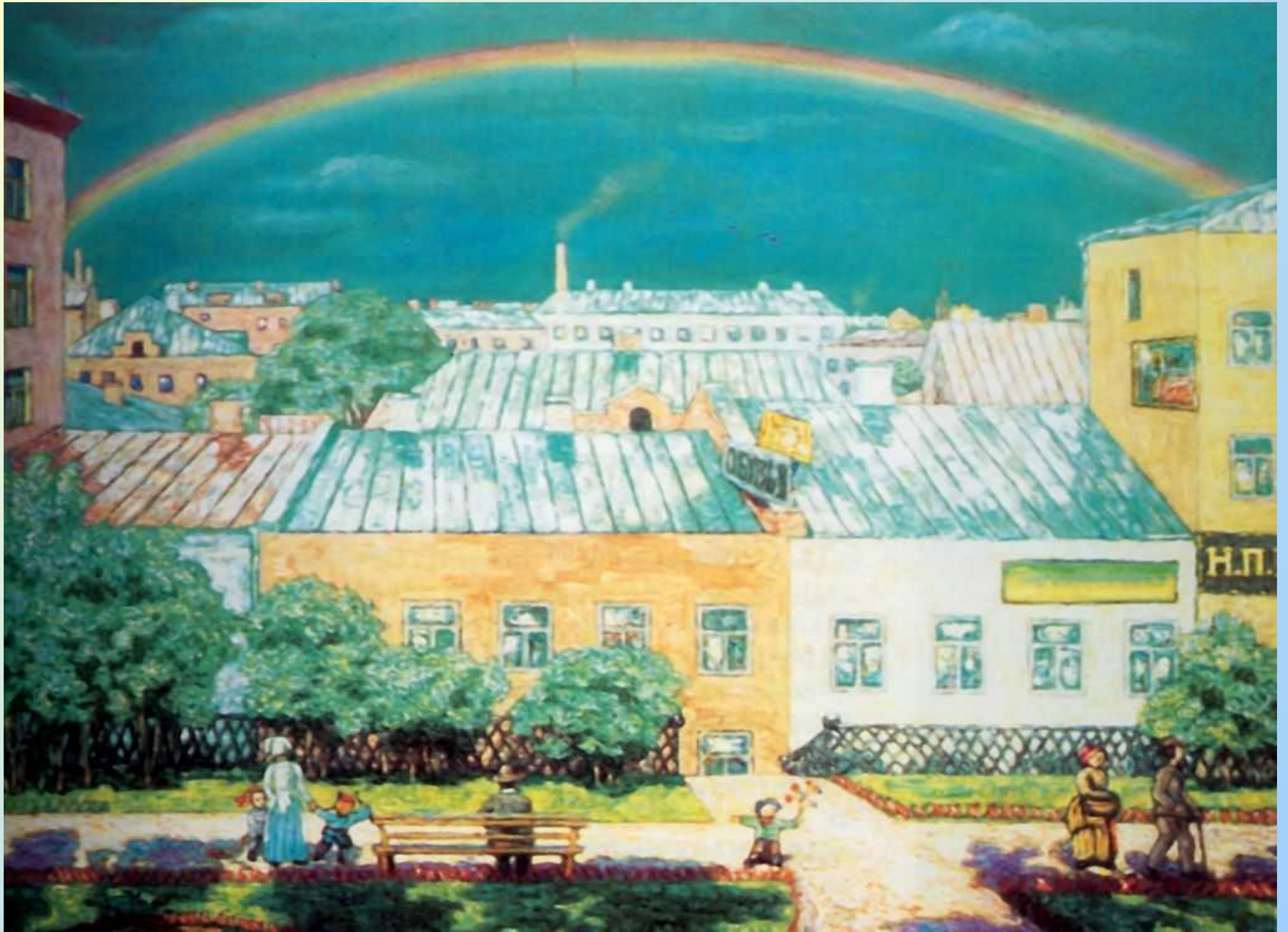
Московский пейзаж. Радуга. 1908