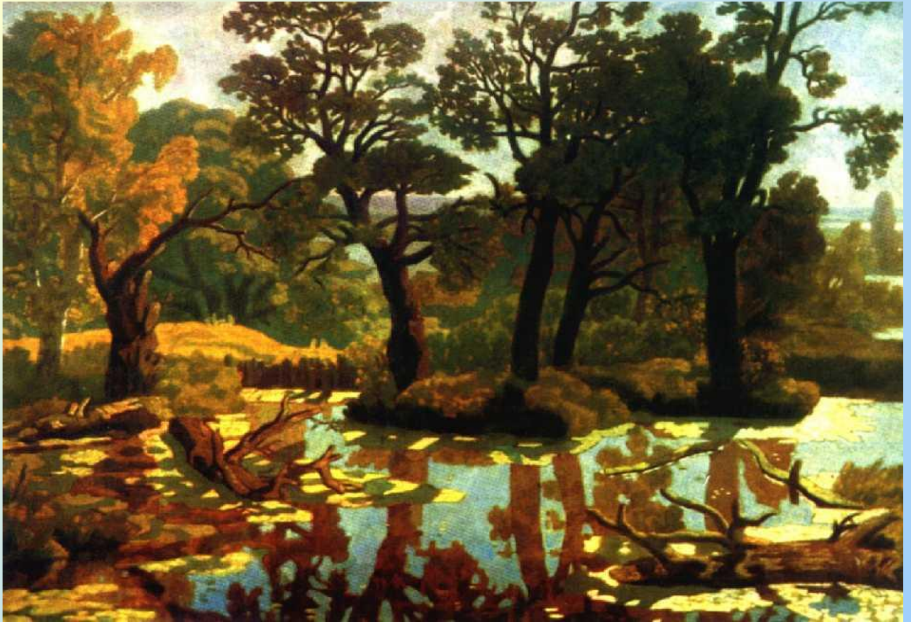
Пейзаж с рекой