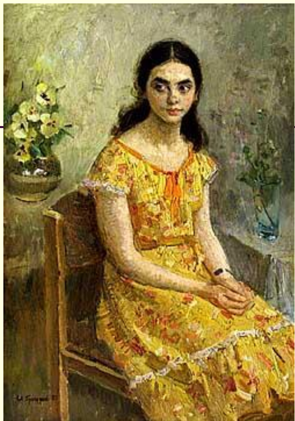
«Девушка из Киева» 1983