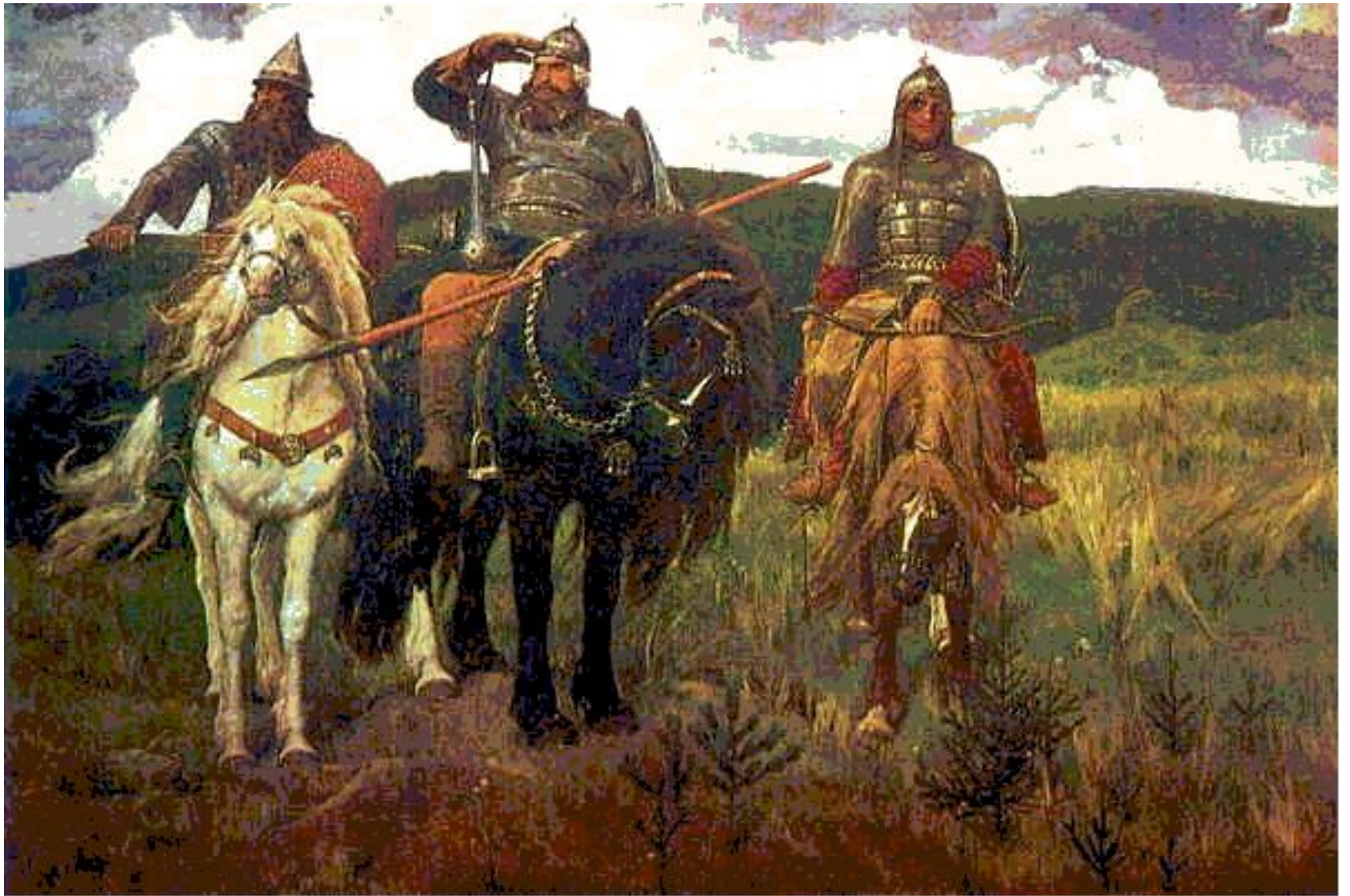
«Богатыри» 1881-1898 год