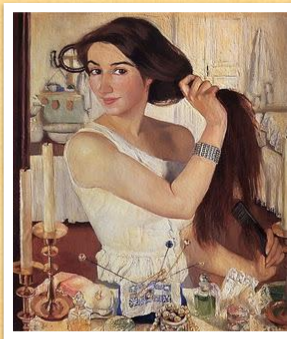
Автопортрет («За туалетом»)