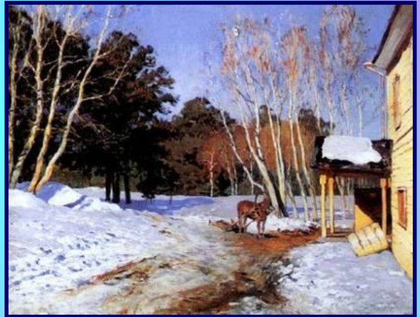
И. И. Левитан «Март»