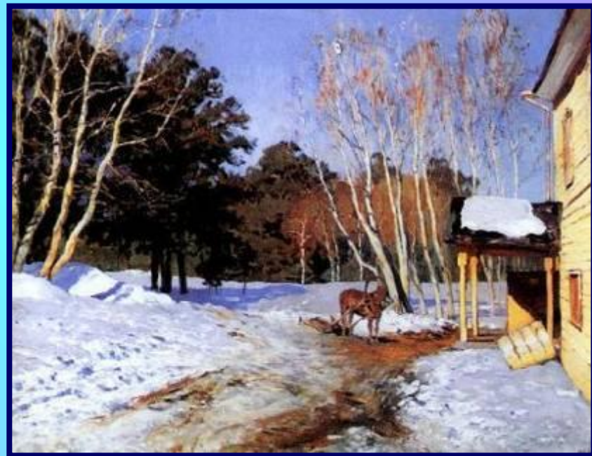
И. И. Левитан «Март»