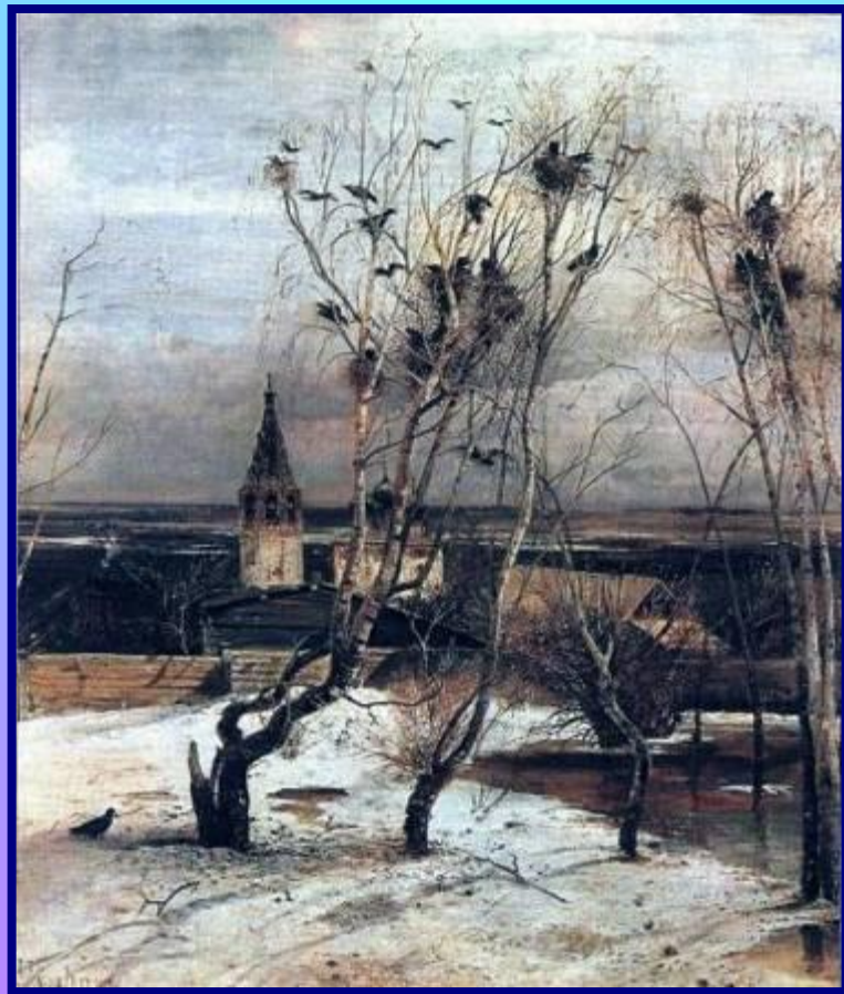
А. К. Саврасов «Грачи прилетели»