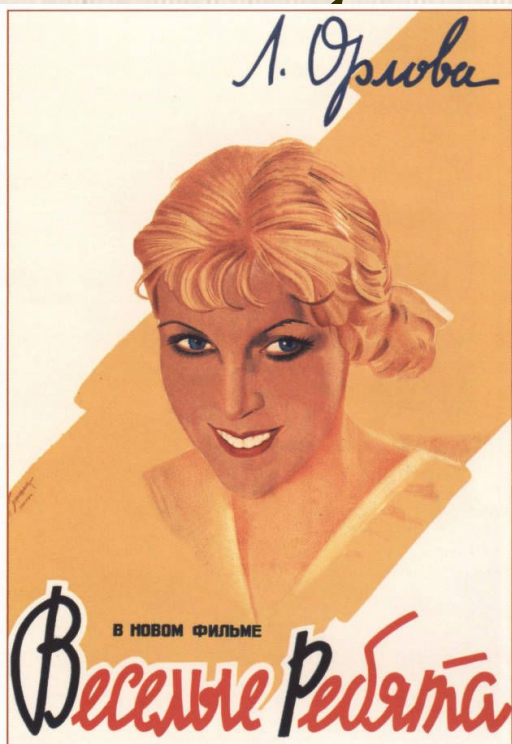
576. Герасимович И. Л. Орлова в фильме «Веселые ребята». Реж. Г. Александров. 1934