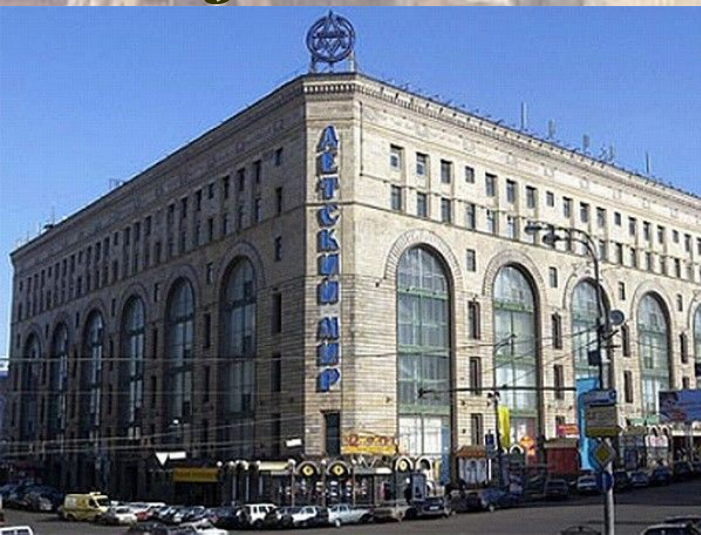
арх. А.Душкин здание Детского мира