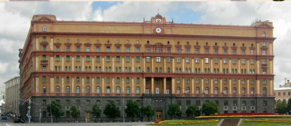
арх. А.Щусев здание НКВД на Лубянской площади