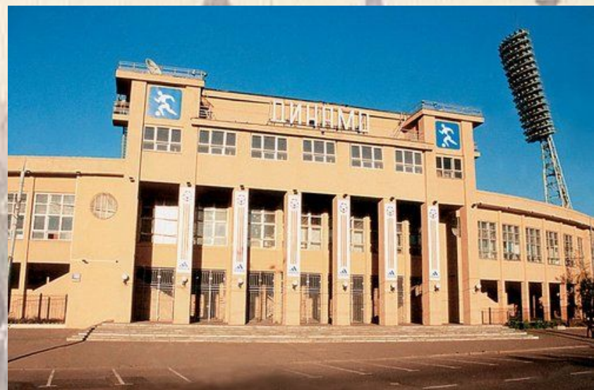
арх. А.Лангман здание стадиона «Динамо»