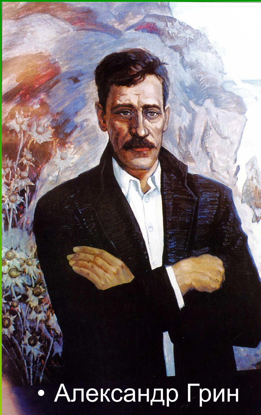
• Александр Грин