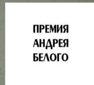
Премия А. Белого