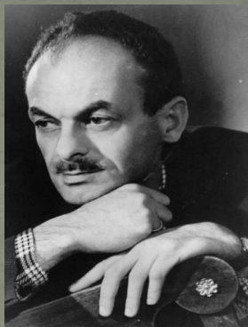
Премия Б. Окуджавы