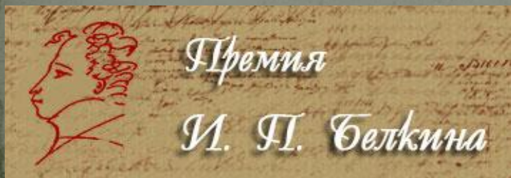
«Премия имени Белкина Ивана Петровича»