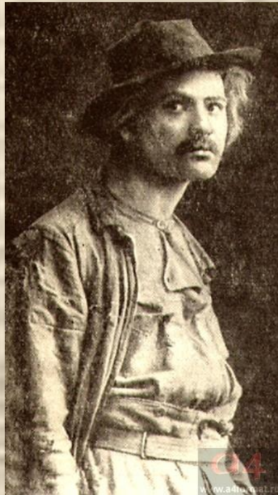
Сатин — Р. Валентин. Спектакль Kleines Theater, Берлин. Фото 1903