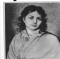
Беттина фон Арним