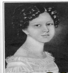
Ульрике фон Левецов