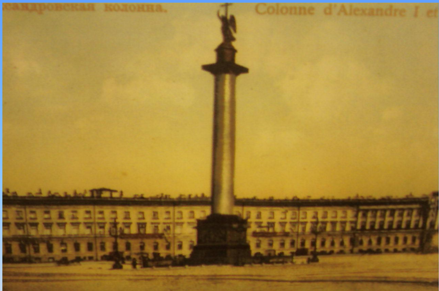
Санкт-Петербург. Александровская колонна.