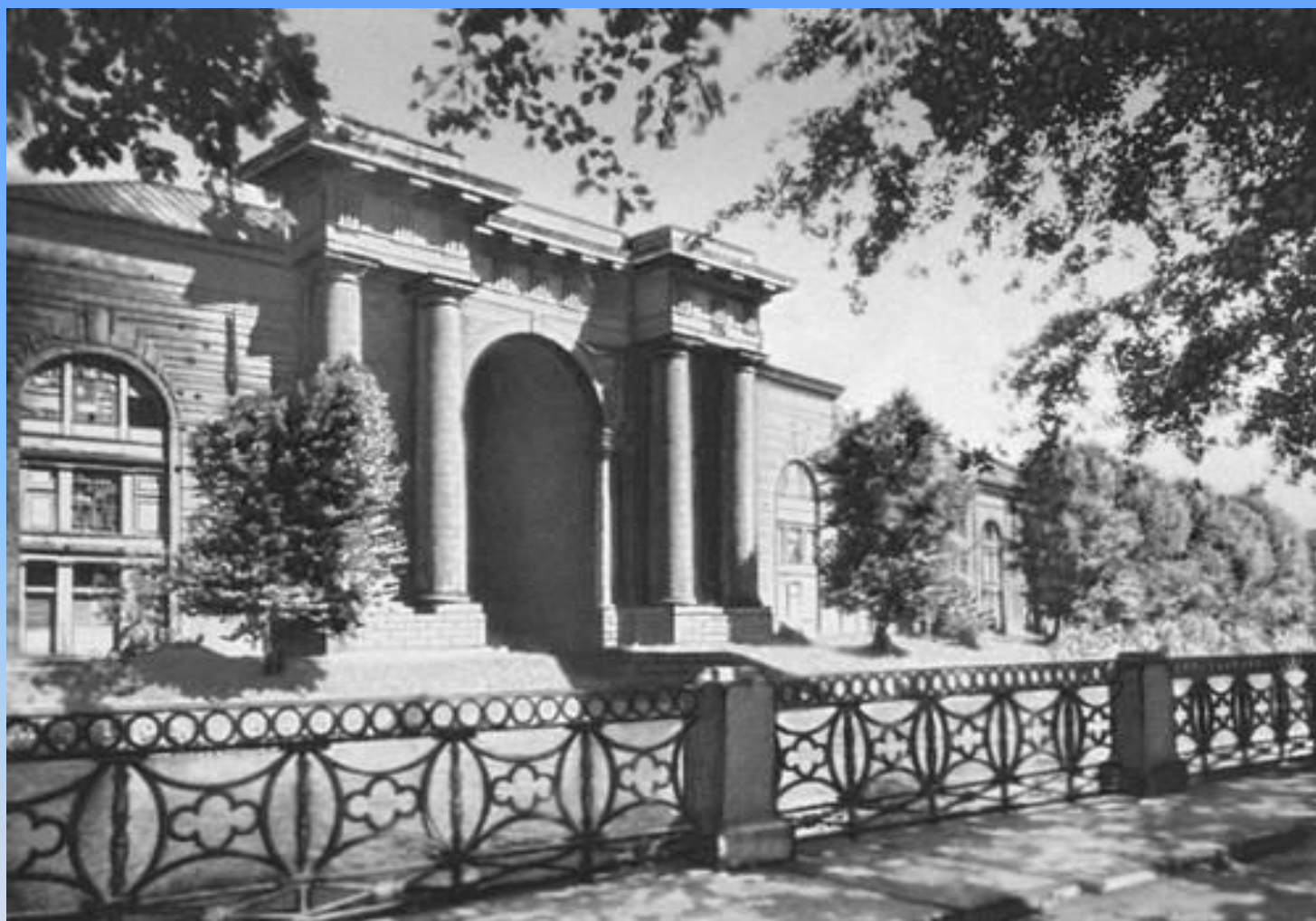
Питер. Склады «Новая Голландия»