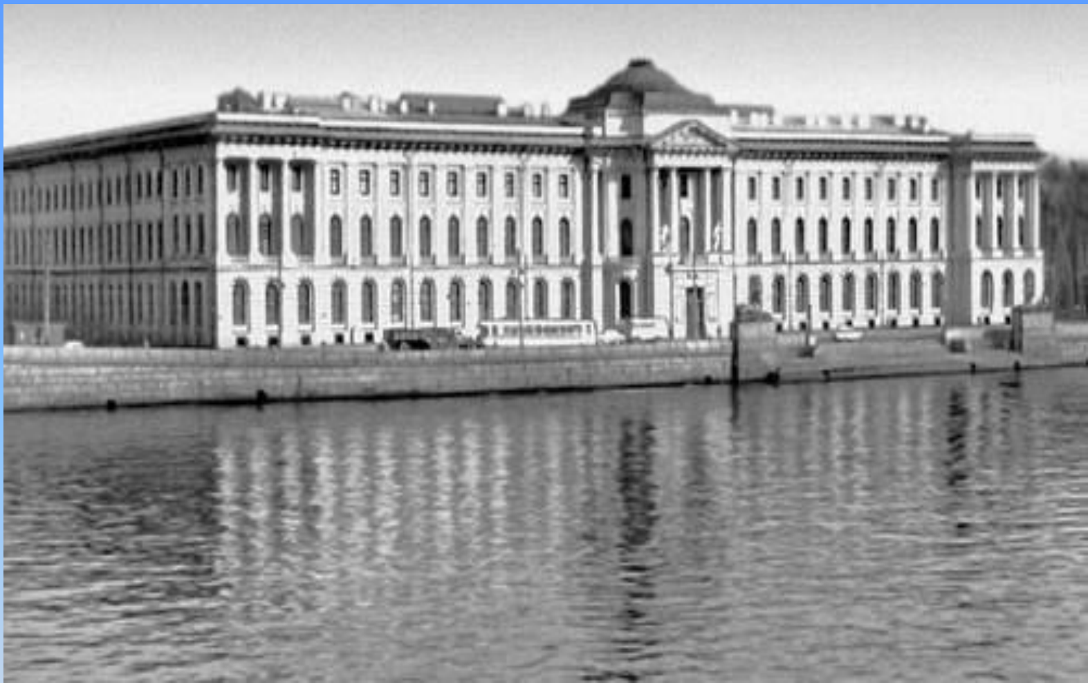
Питер. Кокоринов А. , Вален - Деламов Ж. . Академия художеств.