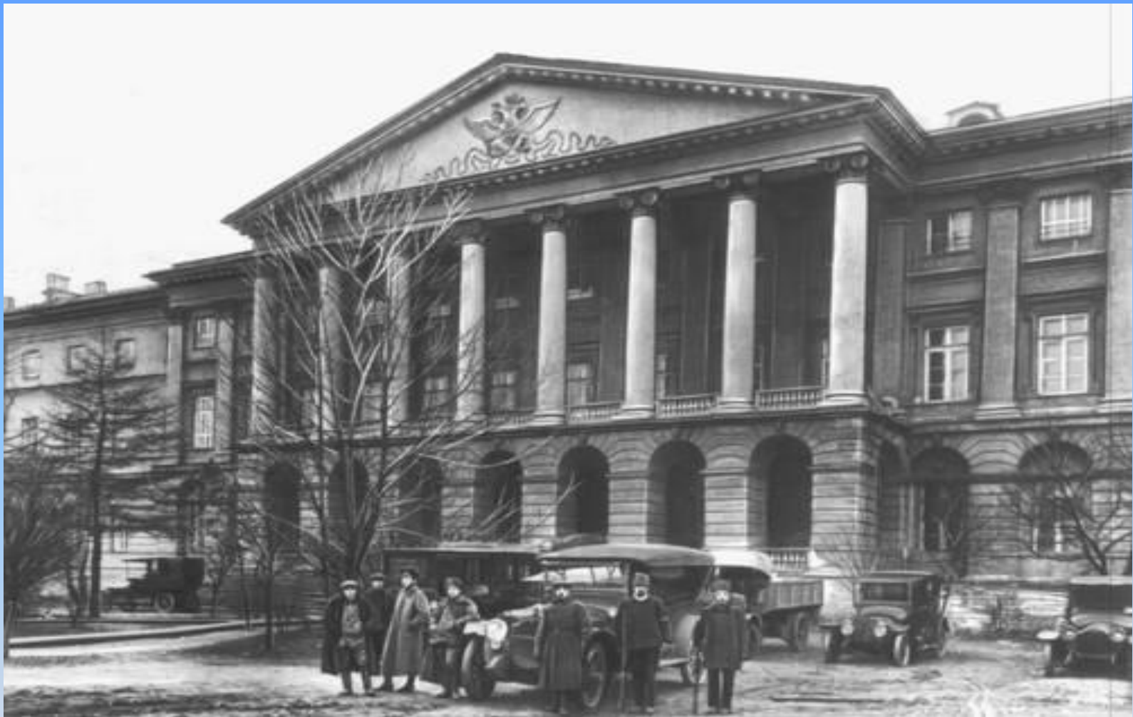
Питер. Смольный (1917).