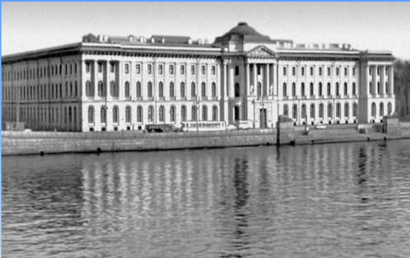
Питер. Кокоринов А. , Вален - Деламов Ж. . Академия художеств.