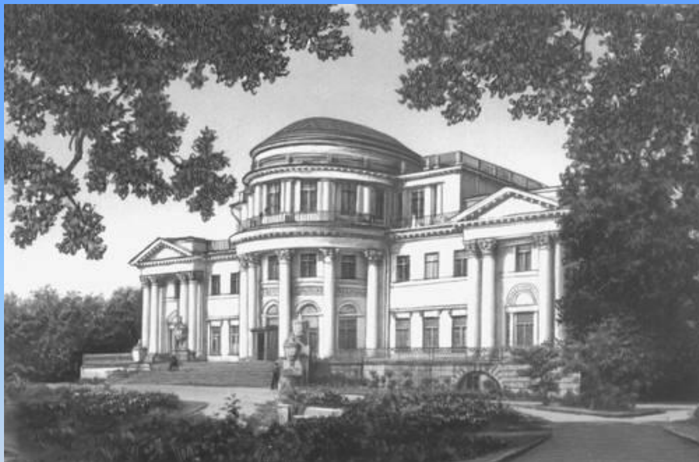
Питер. Елагин дворец.