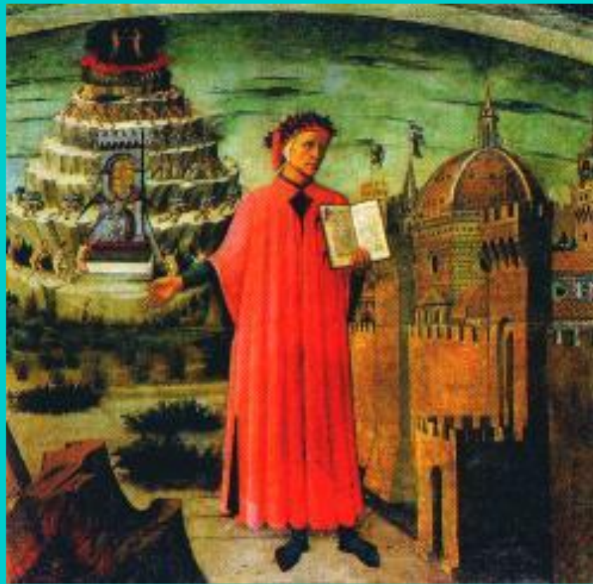
Доменико де Микелино. Данте и три царства.

Самым выдающимся поэтом Средневековья стал Данте Алигьери. Родившись во Флоренции он окончил городскую школу и затем всю жизнь продолжал учиться.