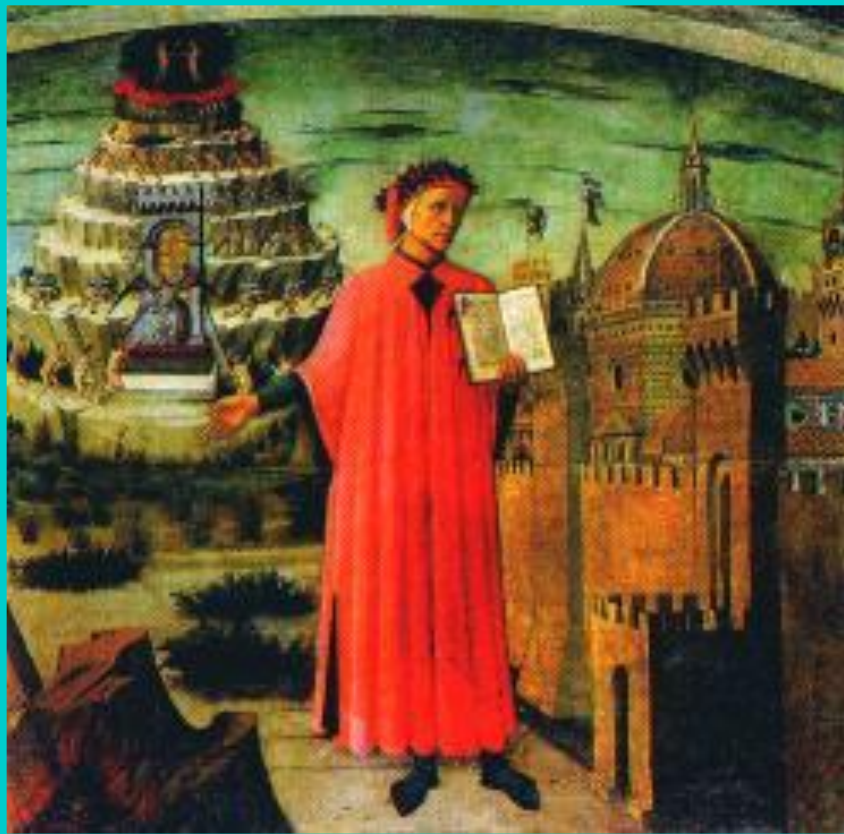
Доменико де Микелино. Данте и три царства.

Самым выдающимся поэтом Средневековья стал Данте Алигьери. Родившись во Флоренции он окончил городскую школу и затем всю жизнь продолжал учиться.