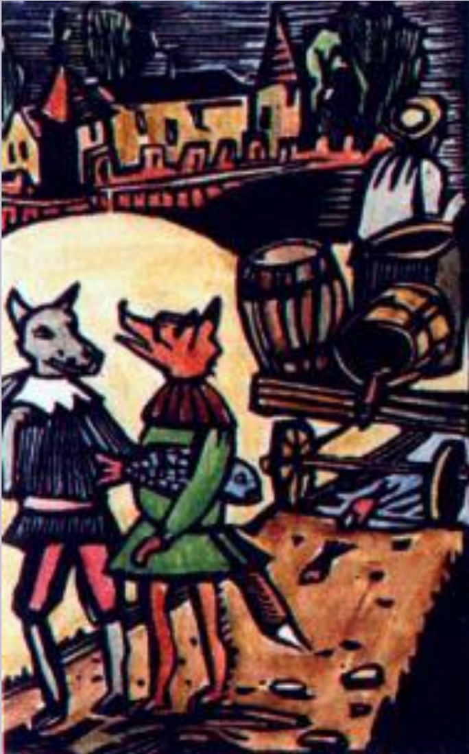
Роман о лисе. Миниатюра 13 в.

В 12 в. литературные произведения стали создавать горожане. Они любили короткие басни и стихи. В «Романе о лисе» (Франция) под видом зверей изображаются люди.