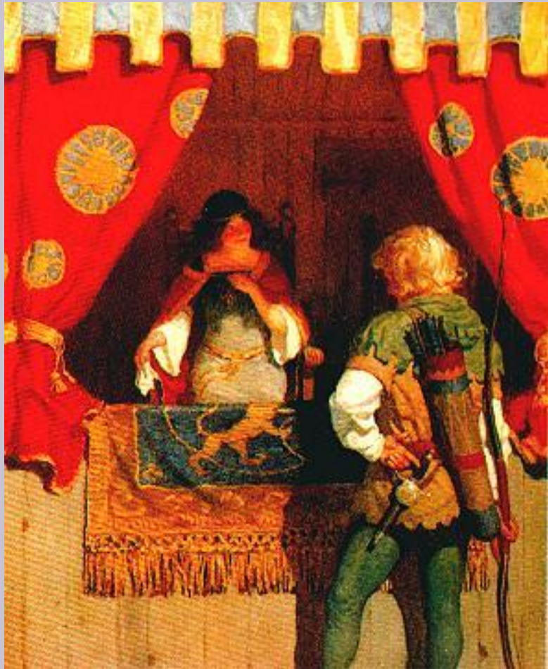
Робин Гуд и Мариана. Миниатюра 14 в.

Мировоззрение крестьян отразилось в устном народном творчестве. В песнях и сказках он стремится к добру и достигает цели с помощью волшебства. В Балладах ситуация иная. Робин Гуд активно протестует против несправедливости и полагается на свою хитрость и помощь друзей.