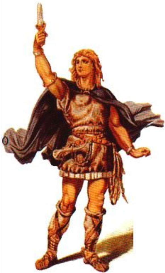
Зигфрид. Трагический герой. «Песнь о Нибелунгах».

В период средневековья бродячие музыканты создали эпосы, посвященные героическим страницам истории.