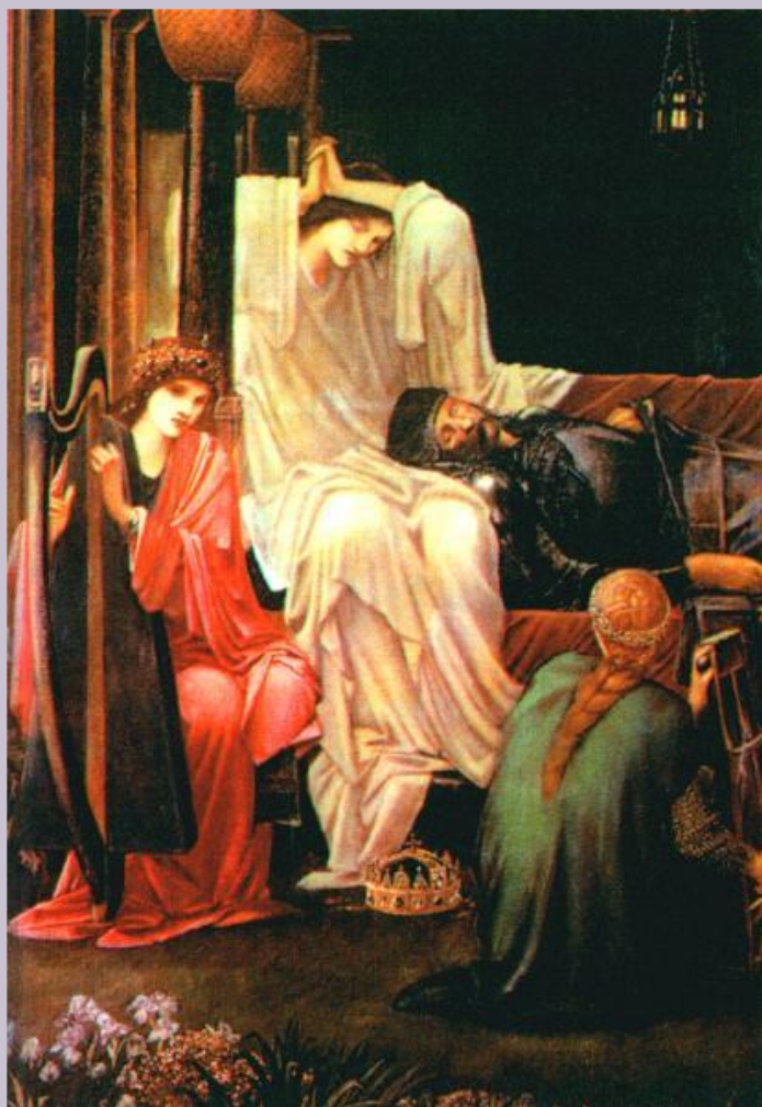
Эдвард Берн-Джонс. Последний сон короля Артура в Аваллоне.

В это же время возникли рыцарские романы и повести. В них широко отразились легенды о Короле Артуре и рыцарях Круглого стола. Окружение Артура, его двор представлялись как мир идеальных рыцарей.