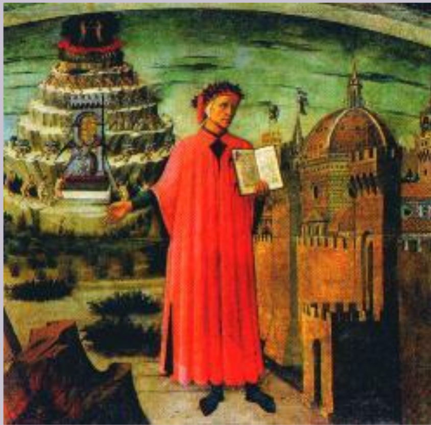
Доменико де Микелино. Данте и три царства.

Самым выдающимся поэтом Средневековья стал Данте Алигьери. Родившись во Флоренции он окончил городскую школу и затем всю жизнь продолжал учиться.