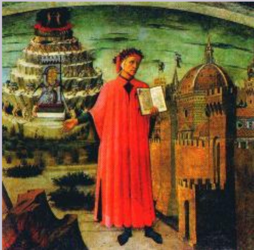
Доменико де Микелино. Данте и три царства.

Самым выдающимся поэтом Средневековья стал Данте Алигьери. Родившись во Флоренции он окончил городскую школу и затем всю жизнь продолжал учиться.