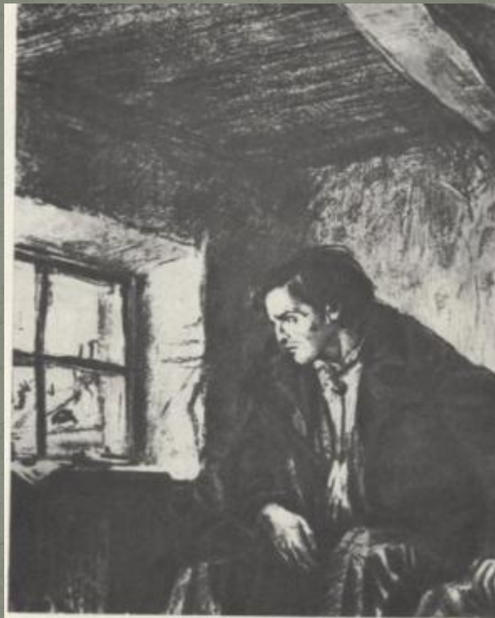
Раскольников. Художник Д. А. Шарьнов. 1936.