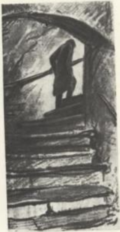
Раскольников на лестнице. Художник Д. А. Шмаринов. 1936