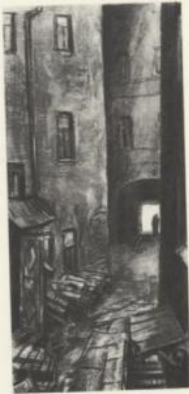
Двор старухи. Художник Д. А. Шмаринов. 1936.

Но почему же тогда рослая сестра старухи-процентщицы Лизавета была « по крайней мере, 8 вершков росту»?