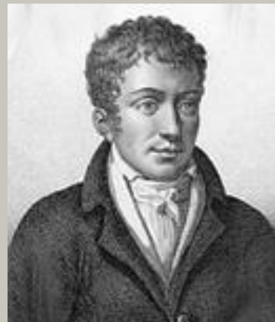
П'єр Жан Жорж Кабаніс