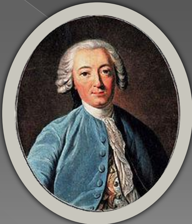
Клод Адріан Гельвецій