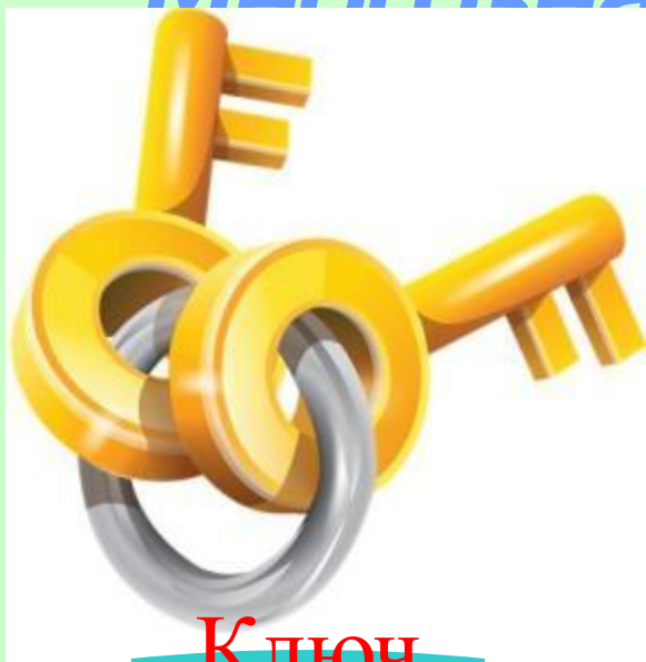
Ключ (от замка)