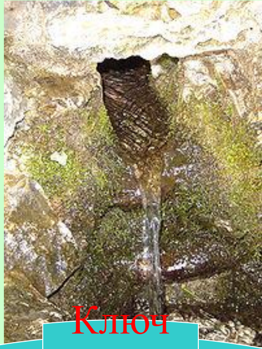
Ключ (родни к)