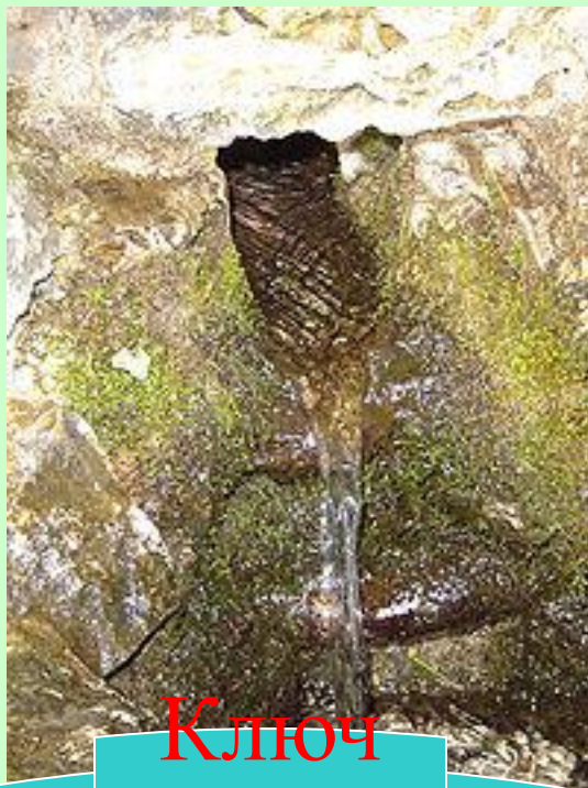
Ключ (родни к)