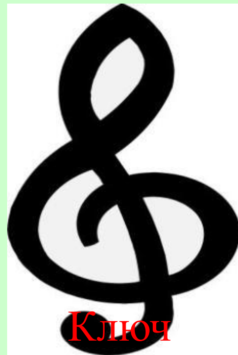
Ключ (музык альный)