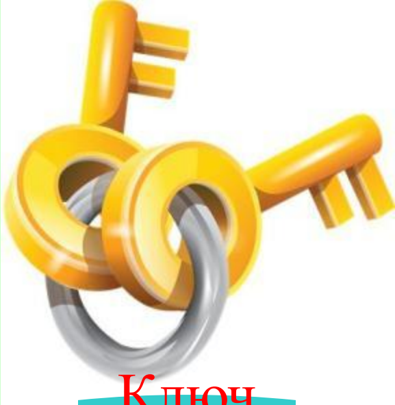
Ключ (от замка)