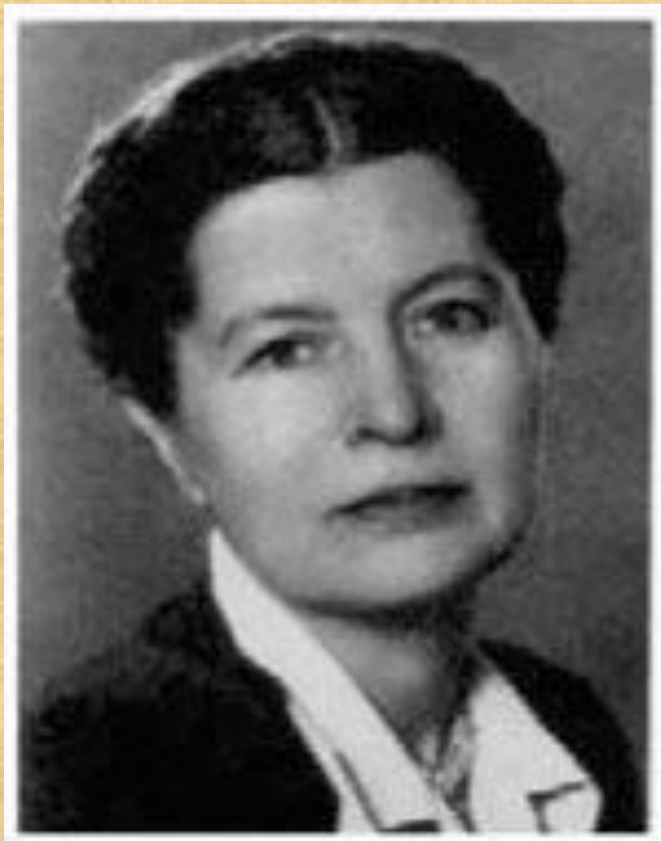
Елена Александровна Благинина