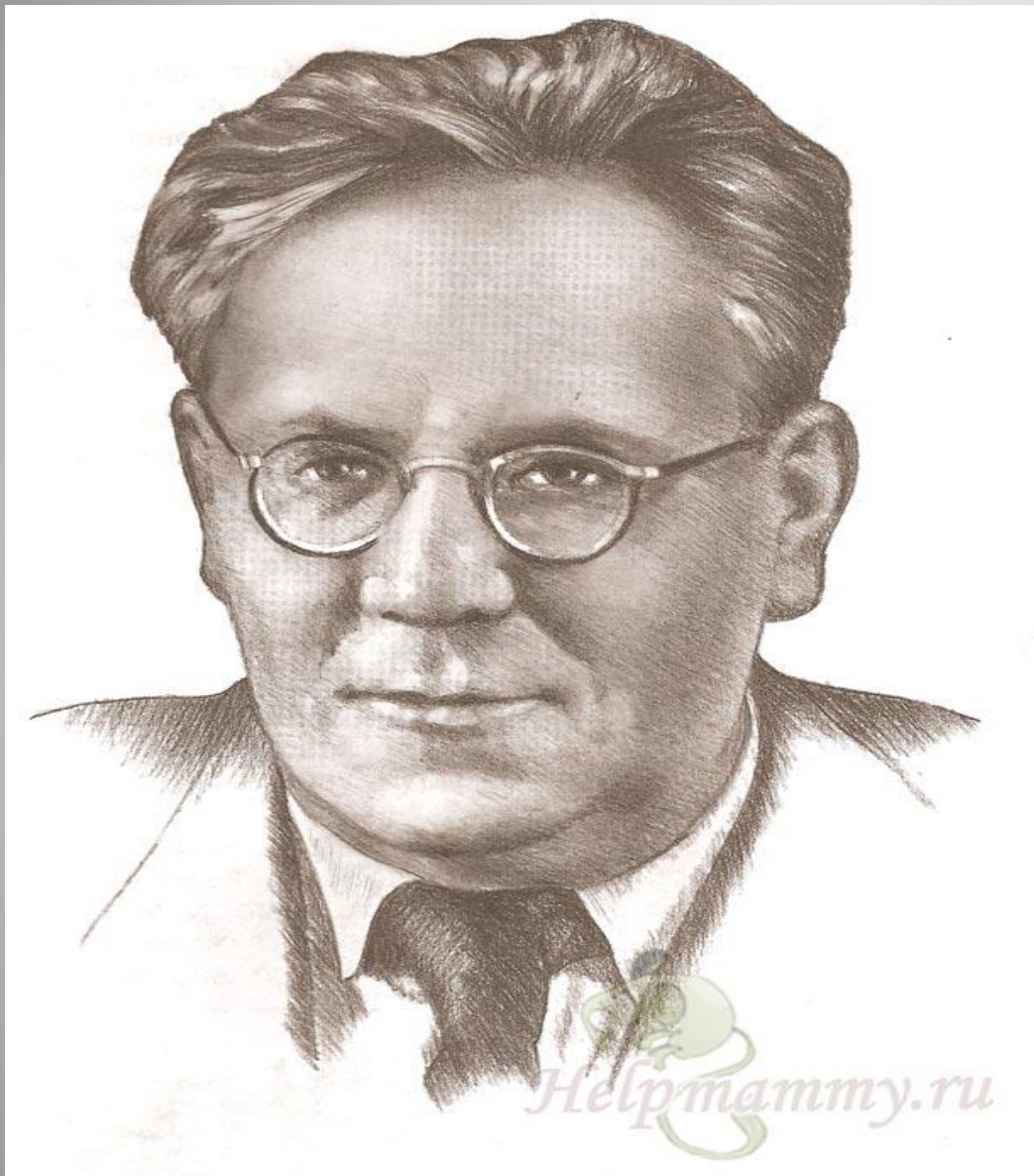
САМУИЛ ЯКОВЛЕВИ Ч МАРШАК (1887-1964)