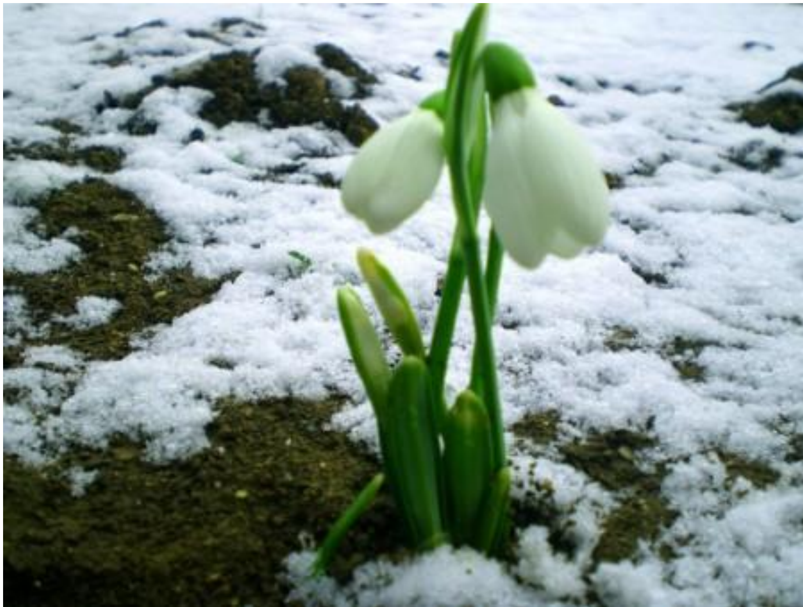
А. А. Фет «Первый ландыш»