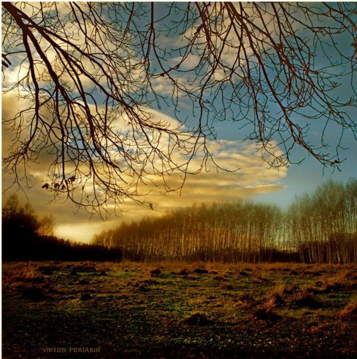
Ф. И. Тютчев «Осенний вечер»