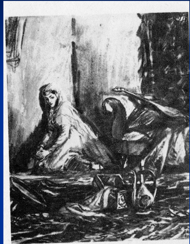
72. «Герой нашего времени». Бэла. Художник Д. А. Шмаринов.