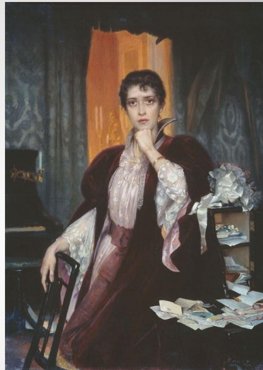
Анна Каренина (по роману Л.Н. Толстого)