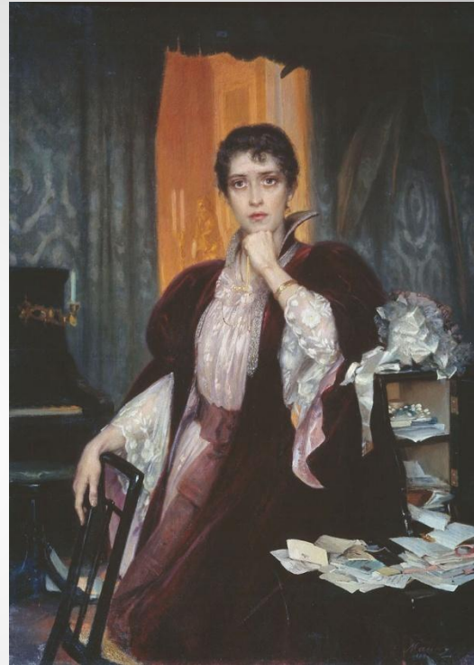
Анна Каренина (по роману Л.Н. Толстого)