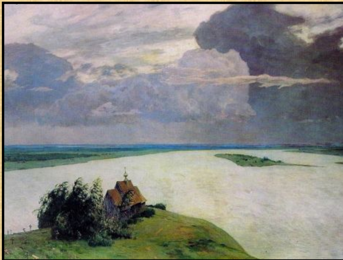
И.Левитан « Над вечным покоем»

- В чем связь стихотворения в прозе Тургенева «Старик» с картиной И.Левитана ?