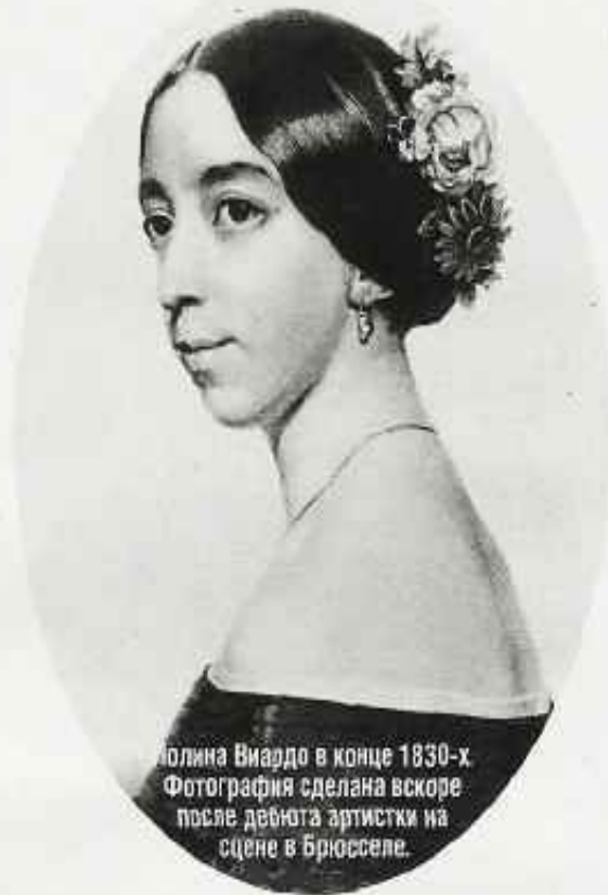
Полина Виардо в конце 1830-х. Фотография сделана вскоре после дебюта артистки на сцене в Брюсселе.