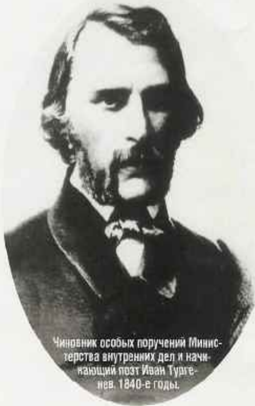
Чинovníк особых поручений Министерства внутренних дел и начинающий поэт Иван Тургенев. 1840-е годы.