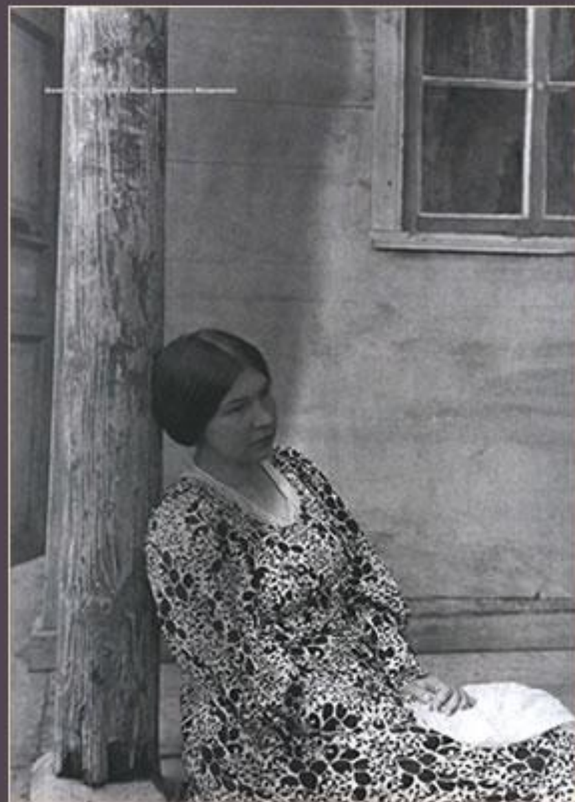
Шахматово, 1909 г.