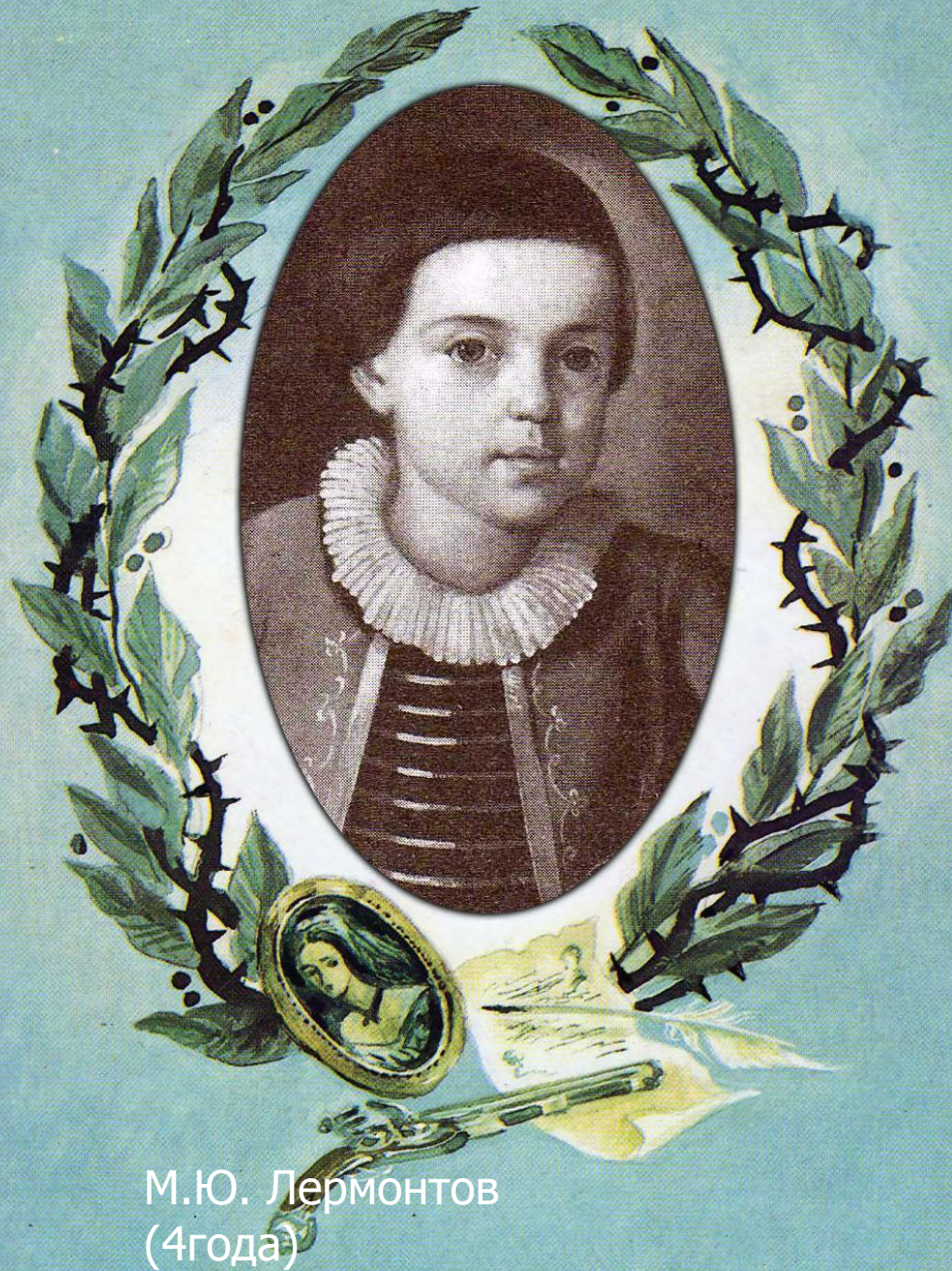
М.Ю. Лермонтов (4года)