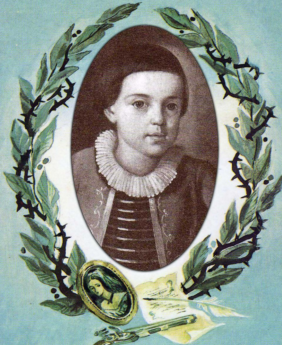
М.Ю. Лермонтов (4года)